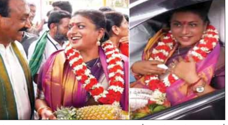
వైసీపీ అధికారంలోకి వస్తే కాలోయే రాజధాని ప్రాంతం కావడంతో వివేకవేషం హైపీ ఉన్న నియోజకవర్గం ఢిల్లీ.