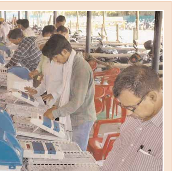
175 నియోజకవర్గాలకు కౌంటింగ్ ఏర్పాట్లు

ఆంధ్ర ఎన్నికల లెక్కింపుకు సన్నాహాలు ముమ్మరంగా జరుగుతున్నాయి. ఈ ఏర్పాట్లపై ఎన్నికల సంఘం ప్రత్యేక దృష్టి సారించింది. ఎన్ని నియోజకవర్గాల్లో పకడ్బందీగా ఎన్నికల కౌంటింగ్ ఏర్పాట్లు చేశారో తెలుస్తుంది. ఆంధ్రప్రదేశ్ రాష్ట్రంలో ఎన్నికల ఫలితాలకు కౌంటింగ్ డౌన్ మొదలైంది. దేశవ్యాప్తంగాను ఎన్నికల ఫలితాలకు కౌంటింగ్ డౌన్ కొనసాగుతున్నప్పటికీ, ఏపీలో ఎన్నికల ఫలితాల పైన మాత్రం దేశం దృష్టి కేంద్రీకృతమైంది. ఏపీలో అత్యంత ప్రతిష్టాత్మకంగా సాగిన అసెంబ్లీ పార్లమెంట్ ఎన్నికలలో విజయకేతనం ఎగరవేసే పార్టీ ఏది అన్నది ఇప్పుడు ప్రధానంగా అందరిలోనూ ఉత్కంఠ ను రేకెత్తిస్తుంది. సమస్యాత్మక ప్రాంతాల్లో ప్రత్యేక భద్రతను ఏర్పాటు చేసింది. కౌంటింగ్ సమయంలో ఎటువంటి అవాంఛనీయ ఘటనలకు జరగకుండా అన్ని జాగ్రత్తలు తీసుకోవాలని అధికారులకు ఆంధ్రప్రదేశ్ ఎన్నికల అధికారి సూచించారు. ఉదయం ఎనిమిది గంటలకు అనుకున్న విధంగా కౌంటింగ్ ప్రారంభమయ్యేలా అన్ని ఏర్పాట్లు చేసుకోవాలని వివరించారు. ఆంధ్రప్రదేశ్ ఎన్నికల ఫలితాలపై అందరి కళ్లు ఉన్నాయి. మళ్లీ వైఎస్సార్సీపీ గెలుస్తుందా.. టీడీపీ కూటమి అధికారంలోకి వస్తోందా అనే చర్చ జరుగుతోంది. జూన్ 4 కోసం అందరూ ఉత్కంఠగా ఎదురు చూస్తున్నారు.. మరో మూడు రోజుల్లో ఫలితాలు వెల్లడికానున్నాయి. అయితే ఓట్ల లెక్కింపునకు సంబంధించి ఎన్నికల సంఘం పకడ్బందీ ఏర్పాట్లు చేస్తోంది. జూన్ 4న కౌంటింగ్లో భాగంగా.. ముందుగా సైకిడకళాల్లో పనిచేసే వారి ఓట్లు ఈటీబీపీఎస్ (ఎలక్ట్రానిక్ ట్రాన్సిమిటెడ్ పోస్టల్ బ్యాలెట్ సిస్టమ్) ఆధారంగా పోలైసీ లెక్కిస్తారు. అనంతరం పోస్టల్ బ్యాలెట్ ఓట్ల లెక్కింపు ఉంటుంది. ఆ తర్వాత ఈవీఎంల లెక్కింపు ప్రారంభమవుతుంది.