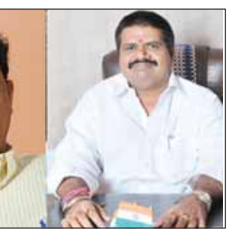
1952 నుంచి ఒకసారి గమనిస్తే.. డి.సి. హిల్స్ ఒకసారి గమనిస్తే చాలా ఆసక్తికరం అంశాలు మనకు గోచరిస్తాయి. 1952లో అరవై వేల ఓటర్లతో ప్రారంభమైన ఈ నియోజకవర్గంలో మొదట్లో స్వతంత్ర, ఆ తర్వాత ప్రజా సోషలిస్ట్ పార్టీ అభ్యర్థులు, ఆ తర్వాత కాంగ్రెస్ అభ్యర్థులు గెలిచారు 1983 డి.డి. అమర్త్యం తర్వాత 1999 వరకు వరుసగా నాలుగుసార్లు డి.డి. గెలిచింది. అప్పట్లో 1989 94 తప్ప మిగతా మూడు టర్నెట్ అధికారంలో ఉండింది డి.డి. అతర్వాత 2004లో కాంగ్రెస్ అభ్యర్థి కల్లె శిశిరారం గెలిచి అప్పుడు కాంగ్రెస్ అధికారంలోకి వచ్చింది.

విశాఖపట్నం.. ఢిల్లీ నియోజకవర్గంలో ఏ పార్టీ గెలిస్తే ఆ పార్టీ దే అధికారమా? అనాదిగా ఆ సెంటిమెంట్ కొనసాగుతూ వస్తోంది. 83లో డి.డి. అమర్త్యం తర్వాత డి.డి.కి కంఠపోతూ ఉన్న ఈ నియోజకవర్గం 2019 లో దక్షిణంకున్న వైసీపీ మళ్ళీ గెలుస్తామన్న ఆశతో ఉంది? లేదంటే రాజీయాల్లోకి వచ్చిన బదు టర్నెట్ నుంచి ఓటమి ఎదురని నాయకుడు బరితేకి దిగాడు కాబట్టి అధికారం మాదే అని డి.డి.కి భావిస్తోంది? ఈ ఆసక్తికరమైన అంశాన్ని ఒక సారి పరిశీలిద్దాం. మొదటి ఢిల్లీ నుంచి 2009 డి.డి.పి.ఎస్. తర్వాత ఢిల్లీని. రాష్ట్రంలోనే అతిపెద్ద నియోజకవర్గం. మూడు లక్షల 60 వేల మంది ఓటర్లు. దాదాపు రెండు నియోజకవర్గాలతో సమానం. సముద్ర తీర పట్టణం. ఆస్పతం ఆక్షేపకర నియోజకవర్గం, రూరల్, అర్బన్ మిక్చర్ ఓటింగ్, అత్యంత పొడవైన నియోజకవర్గం, బిటి హిల్స్, ఏండా, మధురవాడ లాంటి ఖరీదైన ప్రాంతాలు అన్నింటికీ మించి వైసీపీ అధికారంలోకి వస్తే కాలోయే రాజధాని ప్రాంతం కావడంతో వివేకవేషం హైపీ ఉన్న నియోజకవర్గం ఢిల్లీ.