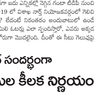
కడప: ఎన్నికల కౌంటింగ్ సందర్భంగా కడప జిల్లాకు చెందిన పోలీస్ అధికారులు కీలక నిర్ణయం తీసుకున్నారు. కడపలోని రోడ్ ఓటుకేంద్రాల జిల్లా బహిష్కరణకు అధికారులు రంగం సిద్ధం చేశారు. జిల్లా నుంచి 21 మంది రోడ్ ఓటుకేంద్రాల బహిష్కరించనున్నారు. జిల్లా వ్యాప్తంగా 1038 మందిపై పోలీసులు రోడ్ ఓటింగ్ తీరారు. 652 మందిని పోలీసులు ముందున్న ఆరెస్టు చేయనున్నారు. అలాగే 131 మందిని గృహసానిటరీ ఉంచుతున్నారు. కడప, బహుళమందుగు, మైదుకూరు నియోజకవర్గాల నుంచి మొత్తంగా 21 మందిని బహిష్కరించనున్నారు. శనివారం ఉదయం నుంచి జూన్ 7 వ తేదీ వరకు జిల్లాలో ఉండ కూడదని ఆదేశాలు జారీ చేశారు. ఇప్పటికే రోడ్ ఓటుకేంద్రాల అందరికీ పోలీసులు నోటీసులు జారీ చేశారు. ఇలాగే సాయంత్రం నుంచి జిల్లా పరిధిలోని పోలీసులు నోటీసుల్లో పేర్కొన్నారు. అన్నమయ్య జిల్లాలో 600 మంది రోడ్ ఓటుకేంద్రాలు ఉన్నాయి. 110 మందిని రోడ్ ఓటుకేంద్రాల పోలీసులు గృహసానిటరీ ఉంచుతున్నారు. అన్నమయ్య జిల్లాలో ఆరుగురు రోడ్ ఓటుకేంద్రాల జిల్లా బహిష్కరణ చేయనున్నారు.