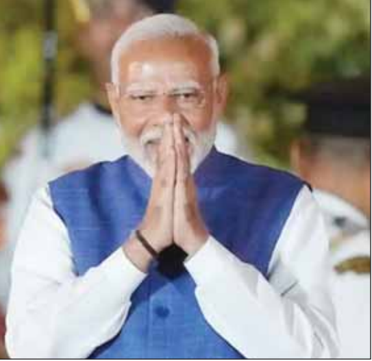
జీ7 దేశాల నేతలందరూ సమగ్రించారు.

అవుతున్నారు. జీ7 సదస్సులో అప్రికా, ఇండో-పసిఫిక్ రీజియన్లకు చెందిన నాయకులు కూడా పాల్గొంటారు. అభివృద్ధి చెందుతున్న దేశాలతో ఆర్థిక సహకారం గురించి చర్చిస్తారు. జీ7 దేశాలు ఇప్పటికే రష్యాపై భారీ ఆంక్షలు విధించాయి. ఒక పెద్ద ఆర్థిక వ్యవస్థపై విధించిన అతిపెద్ద ఆంక్షల ప్యాకేజీ ఇదే. అంతర్జాతీయ వాణిజ్యం, ప్రపంచ ఆర్థిక వ్యవస్థ నుంచి రష్యాను నిరోధించాయి. తమ ప్రాంతాల్లో రష్యాకు చెందిన దాదాపు 300 బిలియన్ డాలర్ల ఆస్తులను స్తంభింప చేశాయి. స్తంభింపచేసిన రష్యా ఆస్తుల నుంచి వచ్చిన వడ్డీని రుణం రూపంలో యుక్రెయిన్ కు ఇచ్చే అంశమీద జీ7 దేశాలు ఇప్పుడు పని చేస్తున్నాయని నవీదీకల ఉన్నాయి. వడ్డీ రూపంలో వచ్చే మొత్తం 50 బిలియన్ డాలర్లు ఉండొచ్చు. గాజాలో యుద్ధాన్ని ముగించేందుకు అమెరికా అధ్యక్షుడు జో బైడెన్ ప్రతిపాదించిన ప్రణాళికను జూన్ 3న