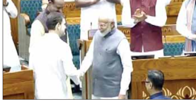
లోక్ సభ స్పీకర్ గా ఓం బిర్లా పరుసగా రెండోసారి ఎన్నికయ్యారు. బుధవారం జరిగిన ఎన్నికలో ఇండియా కూటమి అభ్యర్థి కె.సురేష్ కె ఆయన విజయం సాధించారు. ఈ సందర్భంగా ఓం బిర్లాకు ప్రధానమంత్రి నరేంద్రమోడీ శుభాకాంక్షలు తెలియజేశారు. ప్రజల ఆకాంక్షలను నెరవేర్చేందుకు స్పీకర్ గా ఆయన కీలక పాత్ర పోషిస్తారని విశ్వాసం వ్యక్తం చేశారు.