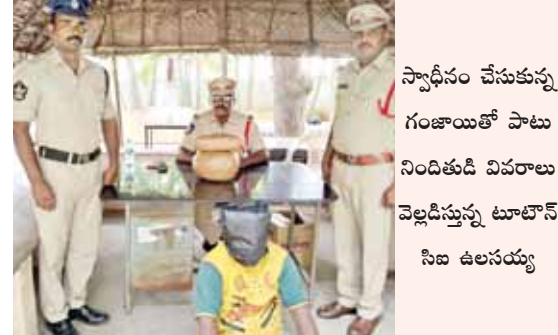
స్వాధీనం చేసుకున్న గంజాయితో పాటు నిందితుడి వివరాలు వెల్లడిస్తున్న టూటౌన్ సీఐ ఉపయ్య

డబ్బులు సంపాదిస్తున్నట్లు పోలీసులు ప్రాథమిక విచారణలో గుర్తించారు. నిందితుడిని రిమాండ్ పంపినట్లు సీఐ తెలిపారు.