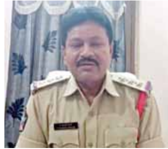
వారైనా ఓడిపోయిన గెలిచిన సమస్యయం పాటించి ఉండాలని తెలిపారు.