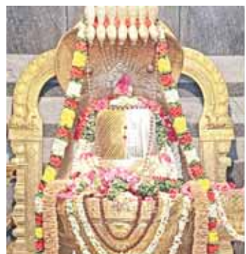
ప్రత్యేక అలంకరణలో శ్రీ కొండమల్లేశ్వర స్వామి

వెదురుకుప్పం, మేజర్ న్యూస్: మాంబేడు పంచాయతీ డిఆర్ అండ్ కండ్రీగ్ సమీపంలోని అరుణగిరి క్షేత్రంలో వెలసి ఉన్న శ్రీ కొండ మల్లేశ్వర స్వామికి భక్తులు విశేష పూజలు చేశారు. స్వామివారిని ప్రత్యేకంగా అలంకరించారు. పూజాది కార్యక్రమాలు నిర్వహించారు. భక్తులు విశేష సంఖ్యలో పాల్గొని స్వామివారిని దర్శించుకున్నారు. భక్తులకు తీర్థప్రసాదాలు అందజేశారు. అనంతరం పంచముఖ ఆంజనేయ స్వామిని భక్తులు దర్శించుకున్నారు. మధ్యాహ్నం అన్నదాన కార్యక్రమాన్ని నిర్వహించారు. అన్న మయ్య కీర్తనలతో భక్తులను అలరింపజేశారు. కార్యనిర్వాహకులు ఏర్పాట్లను పర్యవేక్షించారు.