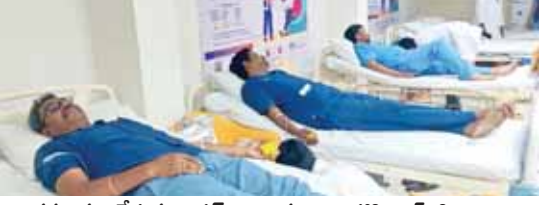
రక్తదానం చేస్తున్న ఆస్టర్ నారాయణాద్రి హాస్పిటల్స్ సిబ్బంది

తిరుపతి ఎడ్యుకేషన్, మేజర్ న్యూస్: రక్తదానంతో ప్రాణాపాయ స్థితిలో ఉన్న రోగుల ప్రాణాలు కాపాడచ్చని ఆస్టర్ నారాయణాద్రి హాస్పిటల్