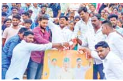
చంద్రబాబు, పవన్, లోకేష్ చిత్రపటాలకు పలాభిషేకం