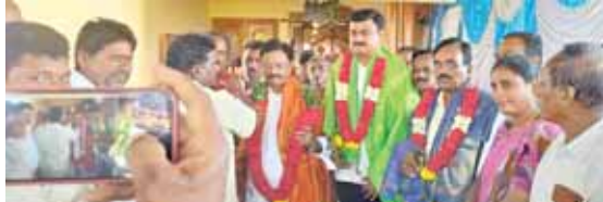
గ్రామ పాఠశాల కార్యక్రమంలో తెలుగుదేశం నాయకులు