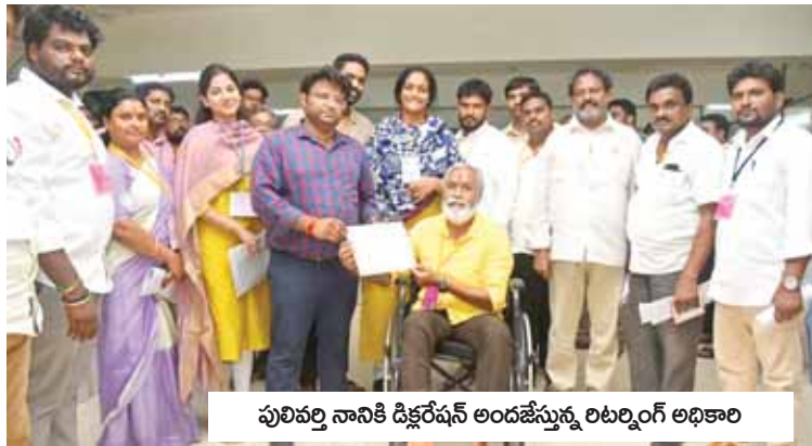
పులివర్తి నానికి డిక్లరేషన్ అందజేస్తున్న రిటర్నింగ్ అధికారి