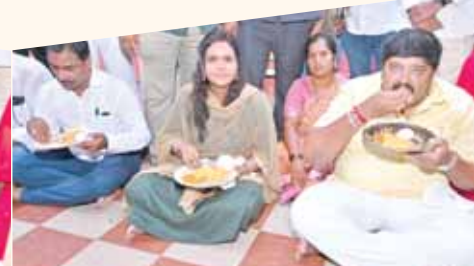
విద్యార్థులకు పాఠశాలకాలం అందజేస్తున్న నియోజకవర్గం ఎమ్మెల్యే గురజాల జగన్ మోహన్, విద్యార్థులకు భోజనం వడ్డిస్తున్న దృశ్యం, విద్యార్థులకి భోజనం తినిపిస్తున్న దృశ్యం, వారితో కలిసి భోజనం చేస్తున్న ఎమ్మెల్యే, కమిషనర్