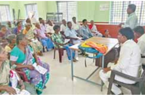
పాల్గొన్నారు. వీరికి చెన్నై శంకర నేత్రాలయ మిషన్ ఫర్ విజన్ వైద్య బృందంతో కంటి పరీక్షలు చేయడం జరిగినది వారిలో కంటికి ఆపరేషన్ నిమిత్తం సుమారు 54మంది ఆపరేషన్ కు ఎంపికైన ప్రజలు అందరికీ విచ్చేసిన ప్రజలకు కూడా మధ్యాహ్నం సంస్థ

పాల్గొన్న శంకర నేత్రాలయ చెన్నై వైద్య బృందం వరదయ్యపాలెం, మేజర్స్ న్యూస్: వరదయ్యపాలెం మండలం చిన్నపాండూరు గ్రామ పంచాయతీ సచివాలయ ఆవరణలో ఉచిత కంటి వైద్యశిబిరం నిర్వహించడం జరిగినది. ఉచిత కంటి వైద్య శిబిరానికివిశేష స్పందన సుమారు 164మంది కంటి సమస్యతో ఇబ్బంది పడుతున్న వారికి పరీక్షలు నిర్వహించగా వరదయ్యపాలెం మండలం, సత్యవేదు మండలం పరిసర గ్రామాలు చిన్న పాండూరు, రాచర్ల, వెంకటాపురం, అంబికాపురం, పాండూరు, తొండంబట్టు, బత్తల వళ్లం, ఇరుగుకుం, మాధనపాలెం గ్రామ పంచాయతీల ప్రజలు ఈ కార్యక్రమంలో