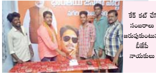
కేక్ కట్ చేసి సంబరాలు జరుపుకుంటున్న బీజేపీ నాయకులు