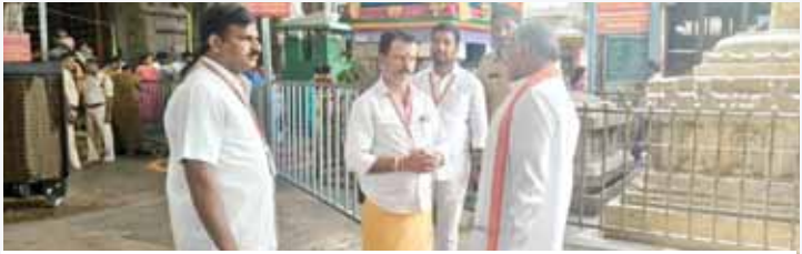
అధికారులకు సూచనలు ఇస్తున్న ఈవో