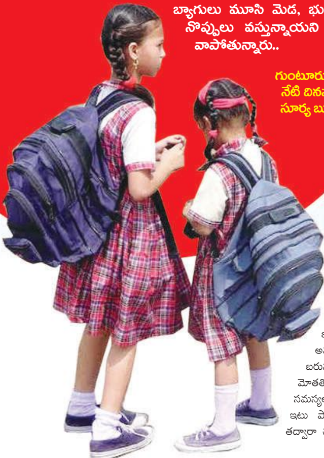
గుంటూరు, జిల్లా నేటి దినపత్రిక సూర్య బ్యూరో

విద్యార్థుల చదవడం బండరాళ్ళు లాంటి పుస్తకాల బ్యాగులు విశేష ప్రభావాన్ని చూపుతున్నాయి. చిన్నారులు బ్యాగులు మోయలేక తీవ్ర ఇబ్బందులు పడుతున్నారు. హమాలీలు మోస్తున్న బరువైన బస్తాల కన్నా బ్యాగుల బరువు ఎక్కువైపోయింది. దీంతో స్కూల్ కి వెళ్తున్న చిన్నారులు తరచూ వ్యాధులకు గురవుతున్నారు. పుస్తకాల బ్యాగులు నిత్యం మోసి మోసి అలసిపోతున్నారు. ఇంటికి వచ్చాక బ్యాగులో మురా నుంచి నీరసంతో కుదేలవుతున్నారు. ఇప్పటికే వచ్చాక బ్యాగులో మురా నుంచి నీరసంతో కుదేలవుతున్నారు. ఇప్పటికే వచ్చాక బ్యాగులో మురా నుంచి నీరసంతో కుదేలవుతున్నారు.