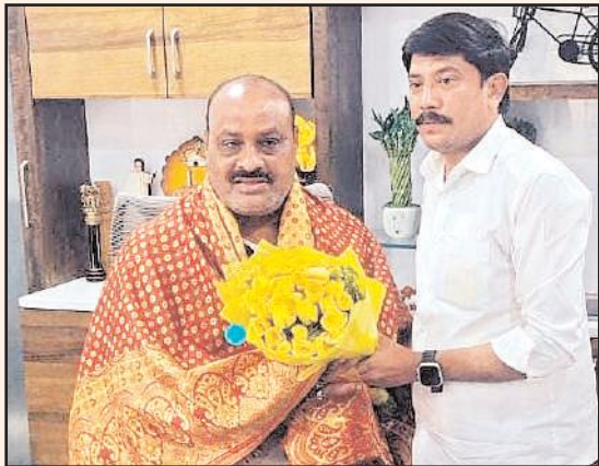
పెదకూరపాడు, మేజర్ న్యూస్