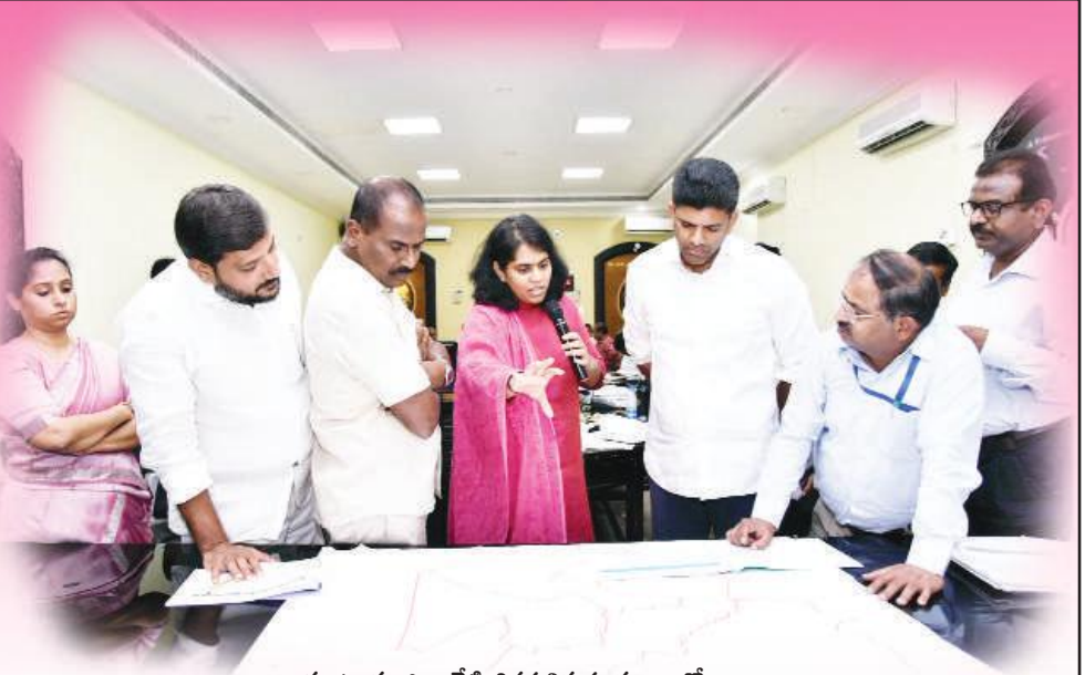
గుంటూరు జిల్లా నేటి దినపత్రిక సూర్య బ్యూరో