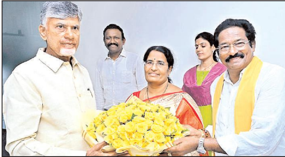
గెలుపుబాటల పరిచిన యువనేత లోకేష్ పాత్ర ఎలాంటి ఎప్పుడు చక్కదిద్దుతారా అని ప్రజలంతా నిరీక్షిస్తున్నారన్నా ఉండబోతోంది, జరిగిన అరాచకాలు, అన్యాయాల్ని రన్నారు. ప్రజలు ఈడ్చికొట్టినా ఇప్పటికీ వైకాపా

నాయకులు, వారి అధ్యక్షుడు జగన్ రెడ్డి నిజాయతీగా ఆత్మపరీక్షలన చేసుకోకుండా తిరిగి ప్రజలపై నిందలు వేయాలని చూస్తుండడం దివాళికోరుతనానికి నిదర్శనమన్నారు. కనీసం ప్రతిపక్ష పార్టీ హోదాకు నోచుకోకుండా మూడవ స్థానానికే పరిమితమైన నేపథ్యంలోనైనా వైకాపా వాళ్ల కళ్లు నేలకు దిగితే మంచిదన్నారు. కొత్తప్రభుత్వం కొలువుదీరాక పోలవరం, అమరావతి నిర్మాణం, పరిశ్రమలు, పెట్టుబడులకు ఆహ్వానంతో పాటు అయిదేళ్లుగా జరిగిన దుర్మార్గాలన్నింటినీ ఆధారాలతో సహా బయటపెట్టి చట్టప్రకారమే వైకాపా దొంగలముఠా అందరిపై చర్యలు తీసుకుంటామనీ తెలిపారు. దానికి సంబంధించి తెలుగుదేశం పార్టీ జాతీయ ప్రధానకార్యదర్శి లోకేష్ వద్ద రెడ్ బుక్ లో ఇప్పటికే వివరాలన్నీ సిద్ధంగా ఉన్నాయన్నారు. తప్పు చేయని వాళ్లను ఇబ్బంది పెట్టేది లేదు, తప్పు చేసిన వాళ్లను వదిలిపెట్టేది లేదని ఇప్పటికే లోకేష్ కూడా ప్రకటించారని ఈ సందర్భంగా ఆయన గుర్తుచేశారు. ఆదేశగా జూన్ 12న చంద్రబాబు ప్రమాణస్వీకారం కోసం ప్రజలందరిలో పాటు, తాము తెలుగుదేశం నాయకులు, శ్రేణులంతా ఎదురుచూస్తున్నామని అన్నారు.