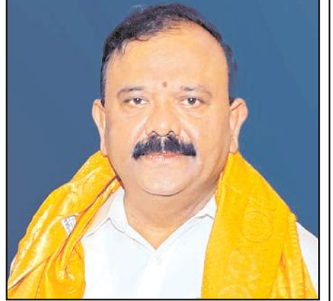
తప్పకుండా ఎవరు ఏ అవసరం ఉన్నా నియోజకవర్గ అభివృద్ధికి సంప్రదించవచ్చు, ఎటువంటి ఆందోళన కూడా ప్రత్యర్థి పార్టీలు పడల్సిన పనిలేదు. దయచేసి మీరందరూ కూడా సంయమనంతో ఉండాలని కోరుకుంటున్నాను. ఎవరికైనా ఇబ్బందులు ఉంటే 9849355955 ఫోన్ చేయండి అని తెలిపారు.

ఎవ్వరి మీద దాడులకు పాల్పడవద్దు, ఎవ్వరూ వ్యాపారుల జోలికి పోవద్దని కోరారు. నియోజకవర్గ ప్రజలందరినీ కూడా ఒకటే కోరుతున్నాను, మీకు ఎవ్వరి సుంపైనా ఇబ్బందులు ఉంటే, దయచేసి నా నెంబర్ మీకు ఇస్తున్నాను, నాతోటి కాంటాక్ట్ చేసి నాకు చెప్పండి మీకు ఏ ఇబ్బందులు లేకుండా నేను చూసుకుంటాను, ఎన్నికల వరకే రాజకీయాలు, ఎన్నికల తర్వాత నియోజకవర్గ ప్రజలందరూ నా కుటుంబ సభ్యులే,