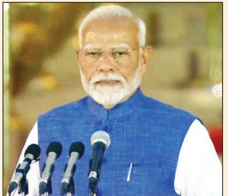
మూడోసారి ప్రధానిగా ప్రమాణ స్వీకారం చేస్తున్న మోదీ