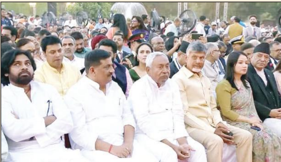
ప్రధానమంత్రి ప్రమాణా స్వీకార మహోత్సవానికి హాజరైన పవన్ కల్యాణ్, చంద్రబాబు నాయుడు

గుంటూరు జిల్లా నేటి దినపత్రిక సూర్య బ్యూరో రాజధానిలో ఆగిపోయిన నిర్మాణ పనులను రాష్ట్ర ప్రభుత్వ ప్రధాన కార్యదర్శి నీరభ్ కుమార్ ప్రసాద్ పరిశీలించారు. ఉద్దండరాయనిపాలెంలో ప్రధాని శంకుస్థాపన చేసిన ప్రాంతాన్ని, సీఆర్డీయే కార్యాలయాన్ని, ప్రజాప్రతినిధుల నివాసాలు, అఖిలభారత సర్వీసు అధికారుల క్వార్టర్స్, హైకోర్టు, నాలుగో తరగతి సిబ్బంది నివాసాలను పరిశీలించారు. ముఖ్యమంత్రిగా చంద్రబాబు నాయుడు ప్రమాణస్వీకారం చేసేలోపు రాజధానిలో పరిశుభ్రత పనులు పూర్తి చేస్తామన్నారు. త్వరితగతిన పూర్తి చేసేందుకు 94 జేసీబీలతో 34 ప్రాంతాల్లో పనులు కొనసాగిస్తున్నామన్నారు. గత ఐదేళ్లుగా ఎలాంటి పనులు చేయని భవనాల నాణ్యతపై ఇంజనీరింగ్ అధికారులతో చర్చించి నిర్ణయం తీసుకుంటామన్నారు. ఏపీ ఔవరేజెస్, మైనింగ్, సీబీడి కార్యాలయాలను జప్తు చేసి వాటిలో కీలక దస్త్రాలు స్వాధీనం చేసుకునేందుకు అన్ని చర్యలు తీసుకుంటున్నామని సీఎస్ చెప్పారు. సీఎస్ తో పాటు సీఆర్డీయే కమిషనర్ వివేక్ యాదవ్ తదితరులు రాజధాని ప్రాంతంలో పర్యటించారు.