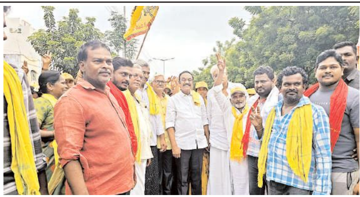
దేశంలో ఎన్నో పార్టీ లున్నా, మాత్రమేనన్నారు. కార్యకర్తల కష్టానికి ఎంతో మంది నాయకులున్నా.. కార్యకర్తల ఆశీర్వాదంతో నడిచే పార్టీ తెలుగు దేశం