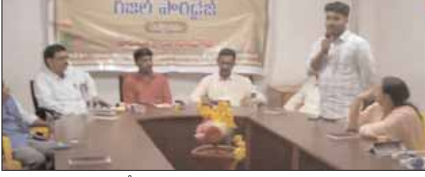
వుస్తకావిష్కరణ సభలో మాట్లాడు తున్న రచయిత ఇనుగుర్తి ప్రభుత్వ అధికారి ఏనుగు తదితరులు. : ముషీరాబాద్ మేజర్ న్యూస్