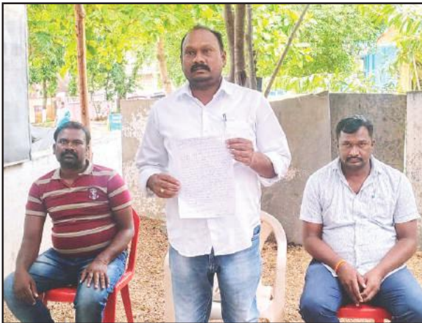
చిత్ర వ్యాఖ్యలు చేయడం మంచి పద్ధతి కాదన్నారు. బీసీ వర్గంలోని వడ్డెర కులానికి చెందిన తాము బీసీ ల సంక్షేమం కోసం అనునిత్యం పాటు పడుచున్నామన్నారు. ఇప్పటికైనా వాస్తవాల తెలుసుకొని మాట్లాడితే బాగుంటుందని ఆయన హితవు పలికారు.