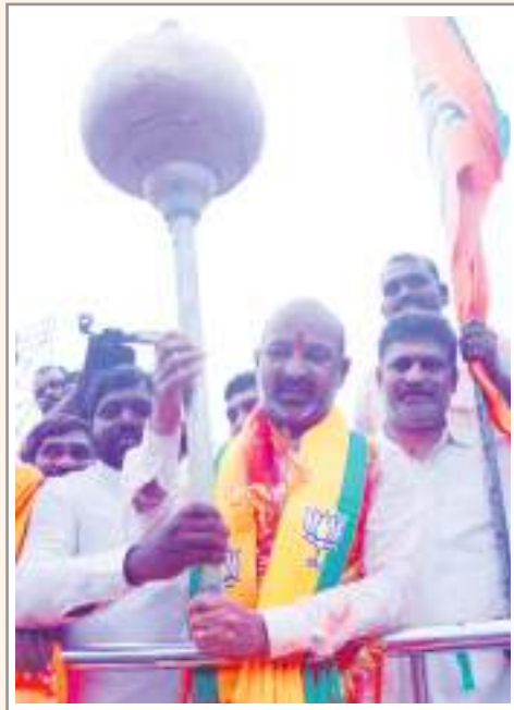
అయోమయానికి గురయ్యారు. లేకుంటే ఎన్డీఎకు 4 వందల సీట్లు వచ్చేవి. అయినప్పటికీ తెలంగాణ ప్రజలు వాస్తవాలు గ్రహించి బీజేపీకి అత్యధిక సీట్లు కట్టబెట్టారు అని అన్నారు.

ఓటేస్తే... ఆయన మోదీకి ఓటేస్తారని నమ్మకంతో గెలిపించారు. తద్వారా నరేంద్రమోదీ ముచ్చటగా మూడోసారి ప్రధాని కాబోతున్నారు. కరీంనగర్ పార్లమెంట్ అభివృద్ధి కోసం గతంకంటే ఎక్కువ నిధులు తీసుకొస్తా. మరింత అభివృద్ధి చేసేందుకు క్రుషి చేస్తానని అన్నారు. కరీంనగర్ లో ఒక వర్గం మళ్ళీ ఒక్కటై నన్ను ఓడించేందుకు ప్రయత్నించింది. కాంగ్రెస్, బీఆర్ఎస్ అభ్యర్థులు వాళ్ల ఓట్ల కోసం కక్కుర్తి పడ్డారు. కేసీఆర్ సైతం కరీంనగర్ కు వచ్చి ముస్లింలంతా ఒక్కటై బండి సంజయ్ ను ఓడించాలని పిలుపునిచ్చారు. చివరకు ఏమైంది? కేసీఆర్ అడ్డన్ గల్లంతు చేశారు. కేసీఆర్ రికార్డును బద్దలు కొట్టి అత్యధిక మెజారిటీ తనకు కట్టబెట్టి కరీంనగర్ ప్రజలు ఓటు బ్యాంకు దమ్మేందో చూపెట్టారు. దయచేసి ముస్లిం వర్గం ఆలోచించాలి. కాంగ్రెస్, బీఆర్ఎస్ పార్టీలు మిమ్ముల్ని ఓటు బ్యాంకుగానే చూస్తున్నాయి. దయచేసి అన్ని వర్గాలను సమానంగా చూడాలన్నదే తన అభిమతం. నా వర్గాన్ని తక్కువ చేస్తే అంతు చూస్తాం... రాజీయే రోజుల్లో రాజీయేది మోదీ రాజ్యమే. రామరాజ్యమే అని అన్నారు. రాజ్యాంగం మారుస్తారని, రిజర్వేషన్లు ఎత్తేస్తారని ఇండి కుట్ర దేశవ్యాప్తంగా విష ప్రచారం చేసి ప్రజలను భయభ్రాంతులను గురిచేసింది. ఇంటికో లక్ష రూపాయలు అకౌంట్లో వేస్తామంటూ సాధ్యంకాని హామీలు గుప్పించి ప్రజలను ఆకర్షించే ప్రయత్నం చేసింది వాళ్లకు దేశం ఎటుపోయినా సంబంధం లేదు... రాజకీయ లబ్ధి కోసం ఎన్నడూ చేయనన్ని కుట్రలు చేశారు. ప్రజాస్వామ్యంపై విశ్వాసం లేదు. దక్షిణ భారతం, ఉత్తర భారతం అంటూ దేశాన్ని చీల్చేందుకు కూడా వెనుకాడలేదు.. వీటితో ప్రజలు