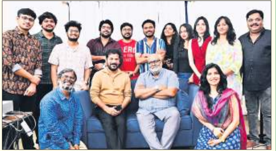
కాకుండా సీరియల్స్ లో, ప్రైవేట్ సాంగ్స్ అనేకం పాడారు.