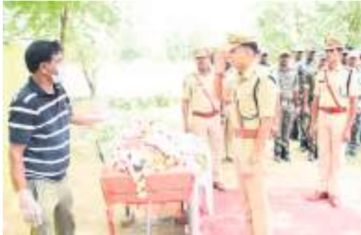
వ్యక్తం చేశారు. ఈ సందర్భంగా ఎస్సీ మాటా దుతూ రాజా గత 14 సంవత్సరాల నుండి జిల్లాలో విఠపి.వివిఠపిలు సందర్శించినప్పుడు