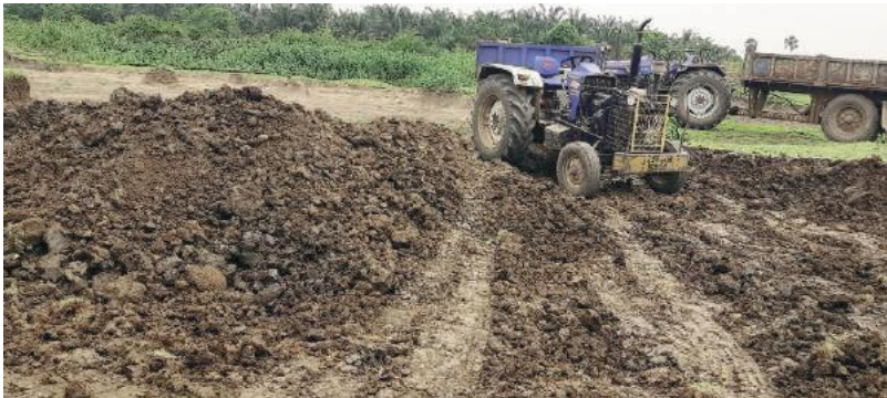
-నీటి నిల్వలకు పొంచి ఉన్న ప్రమాదం...