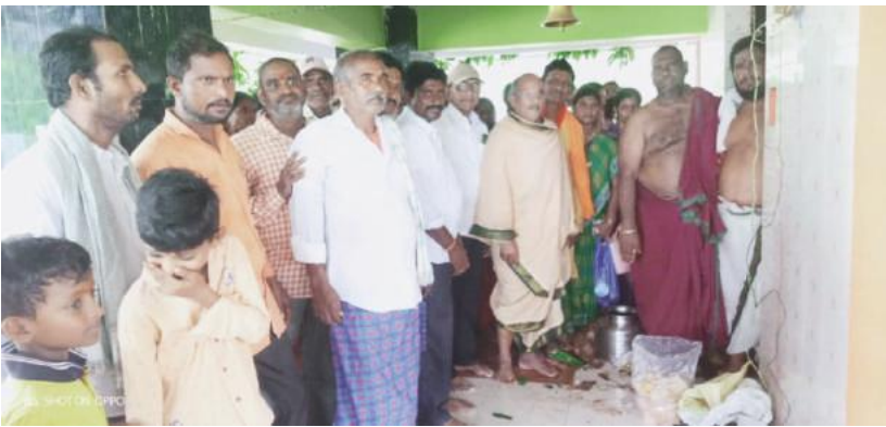
బోనకల్, సూర్య (మేజర్ న్యూస్): మండలంలోని వేడుకలను ఘనంగా జరుపుకున్నారు. స్థానిక పలు గ్రామాలలో భక్తులు హనుమాన్ జయంతి భక్తాంజనేయ దేవాలయంలో శనివారం హనుమాన్