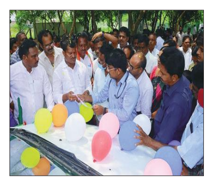
కార్యక్రమంలో వైద్యాధికారులు, హాస్పిటల్ సిబ్బంది, కాంగ్రెస్ పార్టీ నాయకులు, కార్యకర్తలు తదితరులు పాల్గొన్నారు.

మంత్రులకు ప్రత్యేక కృతజ్ఞతలు తెలిపారు. ఈ క్రమంలో వైద్యశాలను పరిశీలించిన ఎమ్మెల్యే జారె హాస్పిటల్ లో రోగులకు అందజేస్తున్న ఆరోగ్య సేవలు, సిబ్బంది ద్వారా అందుతున్న సేవల గురించి తెలుసుకున్నారు. ఇదే క్రమంలో వైద్యశాలలో వసతులను పరిశీలించారు. రోగులు ఇబ్బంది పడకుండా మెరుగైన వైద్య సేవలు అందించాలని ఎటువంటి ఇబ్బందులు వచ్చినా తనకు వెంటనే తెలిపితే సంబంధిత అధికారులతో మాట్లాడి వెంటనే పరిష్కరిస్తానని తెలిపారు. అంతే కాకుండా ప్రభుత్వం పేదలకు నాణ్యమైన వైద్యం అందించేందుకు గాను వైద్యశాలలో అన్ని వసతులు కల్పిస్తుందని వీటిని ప్రతి ఒక్కరూ సద్వినియోగం చేసుకోవాలన్నారు. ఈ