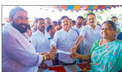
త్వరలోనే అర్జులైన వారందరికీ రేషన్ కార్డు, పెన్షన్..