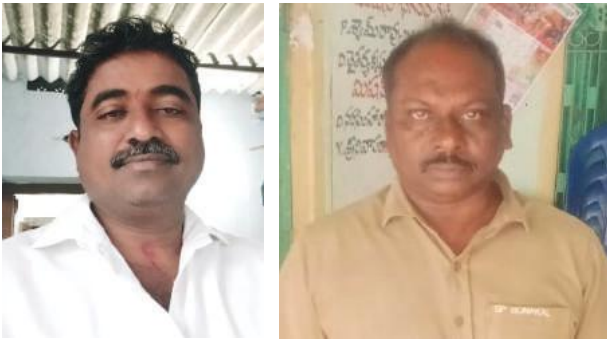
బోనకల్, జూన్ 19 సూర్య (మేజర్ న్యూస్):

-మేజర్ పంచాయతీలలో 5 నెలలుగా పడిగాపులు -అప్పులు పుట్టక ఆర్థిక ఇబ్బందుల్లో బతుకు బండి