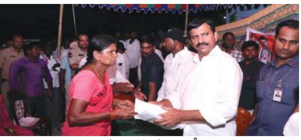
ఖమ్మం, (సూర్య బ్యూరో):

గ్రామాల సర్వతోముఖాభివృద్ధికి ప్రభుత్వం కృతనిశ్చయంతో ఉందని రాష్ట్ర రెవిన్యూ, హౌజింగ్, సమాచార పౌరసంబంధాల శాఖల మంత్రి పొంగులేటి శ్రీనివాసరెడ్డి అన్నారు. బుధవారం మంత్రి, కూసుమంచి మండలం జీళ్ళచెరువు, కేతవాపురం, ధర్మతాండ, పోచారం, కిష్టాపురం, పాలేరు, ఎర్రగడ్డతాండ, నర్సింహులగూడెం, సంధ్యతాండ, లాల్ సింగ్ తాండ, చౌటపల్లి, బొడియాతాండ గ్రామాల్లో పర్యటించి, గ్రామస్థల నుండి ఆర్జీలను స్వీకరించారు. గ్రామ సమస్యలను అడిగి తెలుసుకున్నారు. ఈ సందర్భంగా మంత్రి మాట్లాడుతూ, గ్రామాల్లో రాబోయే సంవత్సరం లోపు ప్రతి గ్రామంలో సిసి రోడ్లు, డ్రైయింగ్ నిర్మాణం పూర్తి స్థాయిలో చేస్తామన్నారు. విద్యుత్ సరఫరాకు కావాల్సిన విద్యుత్ స్తంభాల ఏర్పాటు యుద్ధప్రాతిపదికన పూర్తి చేయాలన్నారు. మొదటి విడతగా తొందర్లోనే కొన్ని ఇందిరమ్మ ఇండ్లు మంజూరు చేయనున్నట్లు, వీటిని పేదవారిలో అతి పేదవారికి చెందేలా చూడాలని, రెండో సంవత్సరం రెండో విడతగా ఇందిరమ్మ ఇండ్లు, స్థలాలు ఇవ్వనున్నట్లు, మూడో సంవత్సరం అర్హులైన ప్రతి ఒక్కరికి ఇందిరమ్మ