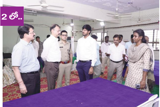
ఖమ్మం, సూర్య బ్యూరో జూన్ 2:

శ్రీ చైతన్య ఇంజనీరింగ్ కళాశాలలో ఏర్పాటు చేసిన ఎన్నికల కౌంటింగ్ కేంద్ర ఏర్పాట్లు తనిఖీ చేసిన అధికారులు.