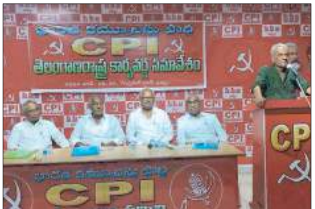
మతోన్నాదులను హెచ్చరించిన ఎన్నికల ఫలితాలు