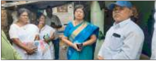
సూర్య కథనానికి స్పందించిన జిల్లా యంత్రాంగం రంగంలోకి వైద్య, ఆరోగ్య శాఖ

డెంగ్యూ, మలేరియా ప్రబలకుండా చకుండా చర్యలు తీరుమలాయపాలెం, సూర్య మేజర్ న్యూస్ : అధిక విష జ్వరాలతో బాధపడుతున్న జిల్లావల్ల గ్రామాన్ని జిల్లా వైద్య ఆరోగ్య శాఖ అధికారిమాలతినందర్చి గ్రామంలో పారిశుధ్యన్ని పరిశీలించారు. జ్వరాలతో బాధపడుతున్న రోగుల ఇబ్బందులను అడిగి తెలుసుకున్నారు. భారీ వర్షాల తర్వాత వచ్చే సీజనల్ వ్యాధులను అరికట్టేందుకు జిల్లా యంత్రాంగం నిర్వహించి వ్యాధి నిర్వహణను నిర్వహిస్తున్నారు. పంచాయతీల్లో ప్రత్యేక పారిశుధ్య కార్యక్రమాలు నిర్వహిస్తున్నారు. పంచాయతీ అధికారులే కాకుండా వైద్య, ఆరోగ్య శాఖ అధికారులు, సిబ్బంది పాలుపంచుకుంటున్నారు. ప్రత్యేక