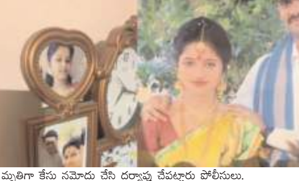
మృతిగా కేసు నమోదు చేసి దర్యాప్తు చేపట్టారు పోలీసులు.

సూర్య మేజర్ స్యూస్ శంషాబాద్ లో విషాదం నెలకొంది. ఇద్దరు పిల్లలకు విషం ఇచ్చి తాను అత్యహత్య చేసుకుందో తల్లి. కర్నాటక బీదర్ నుంచి వచ్చిన కుటుంబం శంషాబాద్ అర్బన్ నగర్ లో అడ్డకు ఉంటోంది.భర్త కొరియర్ ఆఫీస్ లో ఉద్యోగం చేస్తున్నాడు. ఇద్దరు మధ్య ఏం జరిగిందో తెలియదు కానీ 90% ఉదయం భర్త వచ్చి చూ సేసరికి ఫ్యాన్ కి ఉరివేసుకుని కనిపించింది.ఇద్దరు పిల్లలతో ఒకరి పరిస్థితి విషమంగా ఉండడంతో నగరంలోని నిలోఫర్ హాస్పిటల్ కు తరలించారు. విషయం తెలుసుకున్న పోలీసులు సంఘటనా స్థలానికి చేరుకుని కారణాలపై ఆరా తీస్తున్నారు. అయితే అత్యహత్యకు గల కారణాలు తెలియాల్సిఉంది. కుటుంబంలో ఎలాంటి గొడవలు లేవంటున్నారు కుటుంబ సభ్యులు .అనుమానాస్పద