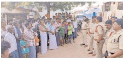
గ్రామస్థులతో మాట్లాడుతున్న సిఐ