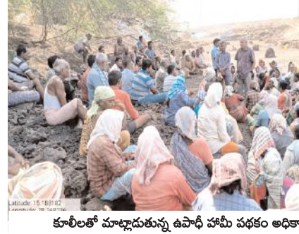
కూలీలతో మాట్లాడుతున్న ఉపాధి హామీ పథకం అధికారులు