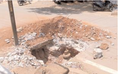
గుంతను పూడ్చుకుండా వదిలేసిన దృశ్యం

ఎమ్మగనూరు టౌన్, మేజర్ న్యూస్ : ఎమ్మి గనూరు పట్టణంలోని వీవర్స్ కాలనీలో కూరగాయలు దుకాణాల ముందు మున్సిపల్ సిబ్బంది పైపు లైన్ మరమ్మతుల కోసం గుంత తవ్వారు.. పూడ్చుకుండా పదిలేశారు. ఆ దారి వైపు వెళ్లే వాహనదారులు పాదచారులు ఇబ్బందులు గురవుతున్నారు. ఆదమరిస్తే తవ్విన గుంతలో పడే పరిస్థితి నెలకొంది. గుంత తవ్విన మున్సిపల్ సిబ్బంది మూడు రోజులు అవుతున్న ఇంతవరకు పూడ్చలేదని ఆ ప్రాంత వాసులు తెలిపారు. కొన్ని వార్డుల్లో మ్యాన్ హోల్ మూతలు కూడా ప్రమాద కరంగా మారాయి. ఇప్పటికైనా మున్సిపల్ అధికారులు స్పందించి సమస్యకు పరిష్కారం చూపాలని ప్రజలు కోరుతున్నారు.