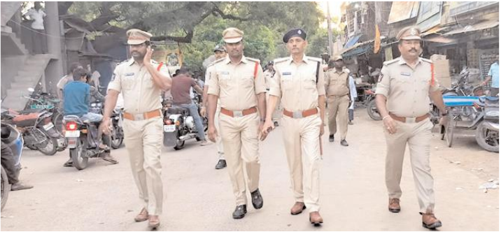
పట్టణంలో కవాతు నిర్వహిస్తున్న పోలీసులు