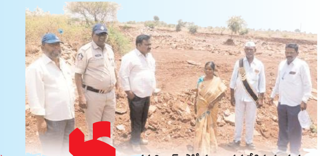
తహసిల్దార్, పోలీసులు పర్యవేక్షిస్తున్న దృశ్యం

మిడ్నూరు, మేజర్ న్యూస్ : మండల పరిధిలోని నాగలూటి గ్రామంలో ఎర్రమట్టి తవ్వకాలు కేజీఎఫ్ ను తలపిస్తున్నందున మండల ప్రజలు చర్చించుకుంటున్నారు. ఈ గ్రామంలో యధేచ్ఛగా అక్రమ ఎర్రమట్టి తవ్వకాలు కొనసాగుతున్నప్పటికీ అధికార యంత్రాంగం మైనింగ్ శాఖ అధికారులు ముమ్మాళ్ళకు పాల్పడి చూసి చూడనట్లు ఉదాసీనంగా వ్యవహరిస్తుండడంతో అక్రమ మట్టి తవ్వకాలు అడ్డు