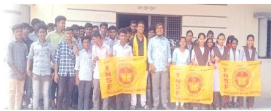
ధర్మా చేస్తున్న టీఎన్ఎస్ఎఫ్ నాయకులు

కౌతాళం, మేజర్ న్యూస్: కౌతాళం పట్టణంలోని ప్రతి ప్రయివేట్, కార్పొరేట్ విద్యార్థుల ముందు బహిరంగంగా ప్రభుత్వ నిబంధనల ప్రకారం ఫీజుల పట్టికను ఏర్పాటు చేయాలని టీఎన్ఎస్ఎఫ్ మంత్రాలయం నియోజకవర్గ ఉపాధ్యక్షుడు