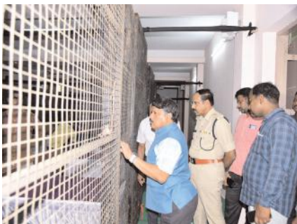
కౌంటింగ్ ఏర్పాట్లను పరిశీలిస్తున్న జిల్లా కలెక్టర్, జిల్లా ఎస్పీ (ఫైల్ ఫోటో)

నంద్యాల, మేజర్ న్యూస్ బ్యూరో : సార్వత్రిక ఎన్నికల ఓట్ల లెక్కింపుకు కౌంట్ డౌన్ మొదలైంది. ఎన్నికల కౌంటింగ్ కు ఏర్పాట్లు పూర్తవుతున్నాయి. కౌంటింగ్ కు నాలుగు రోజులు మాత్రమే మిగిలింది. నంద్యాల జిల్లా కేంద్రమైన నంద్యాల నియోజకవర్గం ఫలితం 21వ రౌండ్ లో రానుంది.