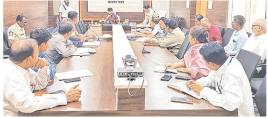
సమావేశంలో మాట్లాడుతున్న సబ్ కలెక్టర్