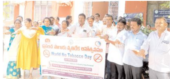
టౌబాకో డే సందర్భంగా అవగాహన ర్యాలీ చేపడుతున్న దృశ్యం