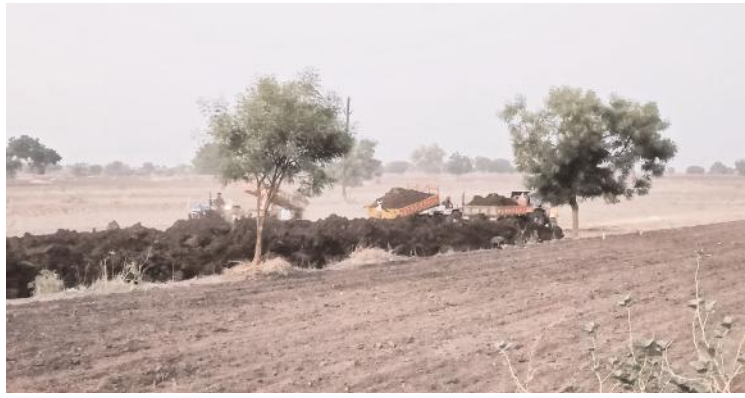
ఒకే చోట మట్టిని నిలువ ఉంచుతున్న దృశ్యం

అన్నంతగా ప్రభుత్వ ఆదాయాలకు గండి కొట్టి దోచేసుకుంటున్నారు. తుంగభద్ర దిగువ కాలువ అధికారులు అందుబాటులో లేకున్నప్పటికీ ఆ అనుమతి కింది స్థాయి అధికారులు ఇచ్చారా అన్నది తెలవాలి. ఒక రైతుకు 250 క్యూబిక్ మీటర్లు మట్టి అనుమతి ఇవ్వాలి ఉండగా.. ఒకే చోట ఒకే రోజు 1000 క్యూబిక్ మీటర్ల మేరకు దేశాయ్ మట్టిని తోడేసు కున్నారు.. చెరువులో రెండు ఇటాచీలు ఒక జెసిపి, దాదాపు 20 ట్రాక్టర్లు మట్టిని తోడేయడం శుక్రవారం ప్రారంభించాయి.. ఇందుకు అక్కడ స్థానిక నాయకులు కార్యకర్తల రైతుల పేరిట ఉంటూ మట్టి నిలువలకు తోడ్పాటు అందిస్తున్నారు.. ఇక్కడ అధికారులు కూడా ఒక్కొక్కరికి ఒక న్యాయం మరొకరికి మరో న్యాయం చేపట్టడం విద్వేషం కనిపిస్తుంది గత నాలుగు రోజుల క్రితం నందవరం మండలం తహసిల్దార్ అదే వులచింత చెరువులో ప్రభుత్వానికి సంబంధించిన కట్టడాలకు గ్రావెల్ తరలిస్తుండగా ఒక జెసిపి తోపాటు కొన్ని ట్రాక్టర్లను స్వాధీనపరచుకొని కేసులో ఇరికించేశారు అన్నది సమాచారం ఉండగా అది కూడా ఒక వాట్సాప్ మెసేజ్ ద్వారా జరిగిపోయింది అని తెలుస్తుంది.. ఇది మండలంలోని ఒక నాయకుడు ప్రభుత్వ పనులకు తరలిస్తుంటే కేసులు బనాయింది అడ్డుకున్న అధికారులు దేశాయ్ చెరువు మట్టి తరలిపోతుంటే ఎందుకు చోద్యం చూస్తున్నారు అన్నది ప్రశ్నార్థకంగా మారింది.. దీంతో మండలంలో ప్రధాన పార్టీ నాయకుడి కంటే ఇటుక బట్టే వ్యాపారులకే పై చేయిగా కనిపించింది.. ప్రభుత్వ పనులకు అడ్డుపడిన అధికారులు.. ఇటుక బట్టే యజమానులు తప్పకుండా మట్టిపై ఎందుకు కేసులు పెట్టడం లేదని మండలంలోని రైతులు ప్రశ్నిస్తున్నారు.