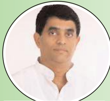
రాష్ట్ర ఆర్థిక మంత్రి బుగ్గన రాజేంద్రనాథ్ రెడ్డి

కర్నూలు, సూర్య ప్రతినిధి : సార్వత్రిక ఎన్నికల నేపథ్యంలో గత నెలలో తనపై నమోదైన ఎస్సీ ఎస్టీ కేసుపై రాష్ట్ర ఆర్థిక మంత్రి బుగ్గన రాజేంద్రనాథ్ రెడ్డి రాష్ట్ర ఉన్నత న్యాయస్థానాన్ని ఆశ్రయించారు. బేతంచెర్ల పోలీసు స్టేషనులో గత నెల 13న నమోదైన ఎఫ్ఐఆర్ 109/2024ను రద్దు చేయాలని ఆయన అదే నెల 21న కోర్టులో క్యాష్ పిటిషన్ దాఖలు చేశారు. సిపిఆర్ఎల్ నంబరు 3720/2024తో కోర్టులో పిటిషన్ అడ్మిట్ అయినట్లు ఈ కేసులో