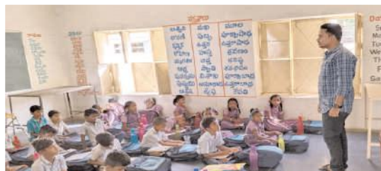
నెరణికి తాండ పాఠశాలలో బోధన చేస్తున్న ఒకే ఉపాధ్యాయుడు

హాళగుండ్, మేజర్ న్యూస్ : హాళగుండ్ మండలంలోని కొన్ని ప్రభుత్వ పాఠశాలలు ఏకోపాధ్యాయులతో కొనసాగుతున్నాయి. మండల పరిధిలోని నెరణికి గిరిజన తాండ, మజర గ్రామమైన కొత్తపేట, నాగరకన్య, హోస్పూర్ ఇతర గ్రామాలలో ఉన్న పాఠశాలలో ఏళ్ళ తరబడిగా ఒకే ఉపాధ్యాయులతో విద్యార్థులకు విద్యా బోధనను అందించే పరిస్థితి దావరించింది. 1 నుండి 5వ తరగతి చదవి విద్యార్థులకు ఒకే ఉపాధ్యాయుల ద్వారా సరైన విద్యా బోధన అందడంలేదని వెంటనే ఉపాధ్యాయుల నియమించాలని విద్యార్థుల తల్లిదండ్రులు గతంలో పాఠశాలలను మూసి వేసి తాళం వేసిన సందర్భాలు ఉన్నాయి. అయినా విద్యాశాఖాధికారులకు మాత్రం చీమ కూడా కుట్టినట్లు లేకుండా వ్యవహరిస్తూ ఈ సమస్య ఒక్క మా మండలంలోని మాత్రం కాదని రాష్ట్ర వ్యాప్తంగా ఉందని బదులు ఇచ్చారు. ఇందుకు మేమేమి చెయలేమని ప్రభుత్వం ఉపాధ్యాయులని నియమిస్తే పోస్టులను భర్తీ చేస్తామన్నారు. ఏడాదికేదాది పాఠశాలలో విద్యార్థుల సంఖ్య