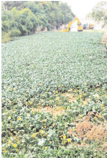
రైల్వే స్టేషన్ కు వ్యాధి కేసీ కాలువలో గుర్రపు డెక్క ఆకును తొలగిస్తున్న యంత్రాలు

పేరుకుపోయిన గుర్రపు డెక్క ఆకు అంశం కూడా ఆయన ప్రస్తావించి అధికారుల తీరును తప్పు పట్టారు. వెంటనే ఆ ఆకు తొలగింపు పనులు చేపట్టాలని అధికారులను ఆదేశించారు. దాంతో వారు చర్యలు తీసుకొని కేసీ కాలువలో గుర్రపు డెక్క ఆకును తొలగించే పనులు వేగవంతం చేశారు. దీంతో రానున్న రోజుల్లో ప్రజలకు దోమల బెడద తొలగడంతో పాటు కేసీ కాలువకు నీరు విడుదల అయితే దిగువకు ఎలాంటి ఆటంకాలు లేకుండా ప్రవహిస్తుందని ఆశాభావంతో ఉన్నారు.