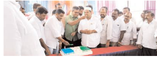
కేక్ కట్ చేస్తున్న వైకాపా నాయకులు

ఎమ్మిగనూరు, మేజర్ న్యూస్ ప్రతినీధి : కర్నూలు మాజీ ఎంపి, ఎమ్మిగనూరు వైకాపా ఇంచార్జ్ బుట్టారేణుక జన్మదిన వేడుకలు ఘనంగా జరిగాయి. శుక్రవారం వైకాపా పార్టీ కార్యాలయంలో వైకాపా శ్రేణులు కేకు కట్ చేసి