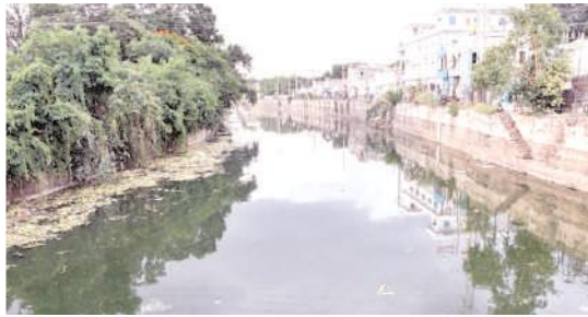
గుర్రపు డెక్క ఆకును తొలగించిన అనంతరం శుభ్రంగా కనిపిస్తున్న కేసీ కాలువ

పేరుకుపోయిన గుర్రపు డెక్క ఆకు అంశం కూడా ఆయన ప్రస్తావించి అధికారుల తీరును తప్పు పట్టారు. వెంటనే ఆ ఆకు తొలగింపు పనులు చేపట్టాలని అధికారులను ఆదేశించారు. దాంతో వారు చర్యలు తీసుకొని కేసీ కాలువలో గుర్రపు డెక్క ఆకును తొలగించే పనులు వేగవంతం చేశారు. దీంతో రానున్న రోజుల్లో ప్రజలకు దోమల బెడద తొలగడంతో పాటు కేసీ కాలువకు నీరు విడుదల అయితే దిగువకు ఎలాంటి ఆటంకాలు లేకుండా ప్రవహిస్తుందని ఆశాభావంతో ఉన్నారు.