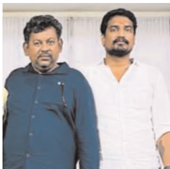
మాట్లాడుతున్న సగరుల నాయకులు