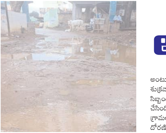
కడమల కాలు గ్రామంలో రోడ్డుపై నిలిచిన డ్రైనేజీ నీరు

బండిఆత్మకూరు రూరల్, మేజర్ న్యూస్ : గ్రామాలలో