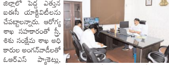
జిల్లాలో పెద్ద ఎత్తున ఐఈసీ యాక్టివిటీలను చేపట్టాలన్నారు. ఆరోగ్య శాఖ సహకారంతో స్త్రీ, శిశు సంక్షేమ శాఖ అధికారుల అంగన్ వాడీలతో ఓఆర్ఎస్ ప్యాకెట్లు, జింక్ కార్పర్ను ఏర్పాటు చేయాలన్నారు. చిన్నారల్లో గ్రోత్ మానిటరింగ్ నిర్వహించడంపై అంగన్ వాడీ వర్కర్ల శిక్షణ ఇవ్వడం, తక్కువ బరువు ఉన్న పిల్లలకు పోషకాహారం అందించడం చేయాలన్నారు. తాగునీటి పైపైలెన్ల లీకేజీలను అరికట్టాలని, పూర్తిగా తనిఖీ చేసి లీకేజీలను నియంత్రించాలని కలెక్టర్ ఆదేశించారు.