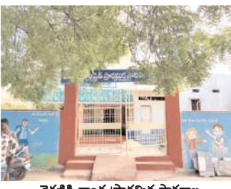
నెరణికి తాండ ప్రాథమిక పాఠశాల

ఏర్పడిన రాష్ట్ర ప్రభుత్వ ముఖ్యమంత్రి నారాచంద్రబాబునాయుడు తోలి సంతకం మేగా డిఎస్సీపై పెట్టారని త్వరగా డిఎస్సీ ద్వారా ఉపాధ్యాయుల పోస్టులను భర్తీ చెయాలని ఉపాధ్యాయులు, విద్యార్థుల తల్లిదండ్రులు ప్రభుత్వాన్ని కోరుతున్నారు. ఆదేవిధంగా కొత్తపేట ప్రభుత్వ పాఠశాల పురతన భవనంకావడంతో శిథిలావస్థకు చేరుకుంది. భవనం వర్షం వస్తే కారుతుంది. వంట చెయడానికి వంట గది కూడా లేదు ఆరు బయటనే వంటకాలు చేస్తున్నారు. ఈ సమస్యను వెంటనే విద్యాశాఖాధికారులు పరిష్కరించాలని ప్రజలు కోరుతున్నారు.