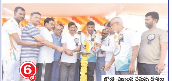
జ్యోతి ప్రజ్ఞులన చేస్తున్న దృశ్యం