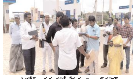
పెట్రోల్ బంకు తనిఖీ చేస్తున్న జాయింట్ కలెక్టర్

- ఆకస్మికంగా తనిఖీ చేసిన ఆరేబికే కేంద్రం