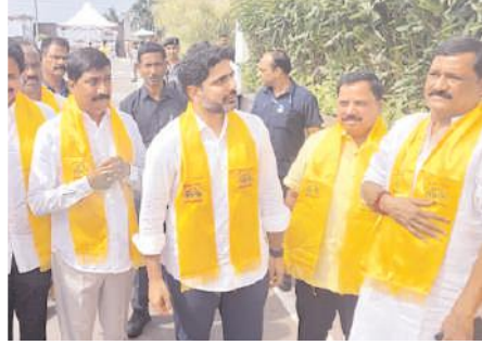
నారా లోకేశ్వర్ మంత్రి బీసీ

బనగానపల్లె మేజర్ న్యూస్: బనగానపల్లె శాసన సభ్యులు రోడ్డు భవనాల శాఖా మాతృలు బీసీ జనార్ధన్ రెడ్డి శుక్రవారంనాడు రెండవసారి బనగానపల్లె శాసన సభ్యునిగా ప్రమాణస్వీకారం చేశారు. అనంతరం అసెంబ్లీ ప్రాంగణంలో తెలుగుదేశం పార్టీ జాతీయ ప్రధాన కార్యదర్శి మంత్రి నారా లోకేశ్వరులు మర్యాదపూర్వకంగా కలిసి పార్టీ కండువావేసి సత్కరించారు.