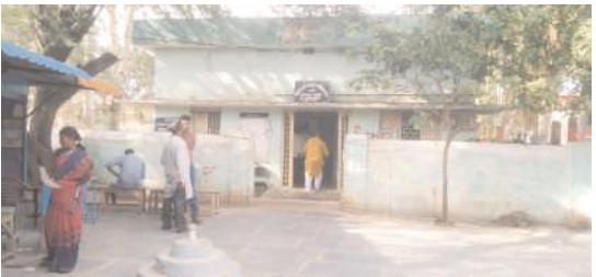
సబ్ రిజిస్ట్రార్ కార్యాలయం