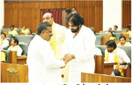
ఉప ముఖ్యమంత్రి పవన్ కళ్యాణ్ తో ఎమ్మెల్యే కోట్ల డోన్ లభ్యమై సహకరించండి : డోన్ నియోజకవర్గంలో తాగు సాగునీటికి అనేక ఇబ్బందులు ఉన్నాయని వాటిని

మా నమ్మకాన్ని నిలబెట్టారు : నారా లోకేష్ : శాసనసభ సమావేశం ముగిసిన తర్వాత శాసనసభ బయట మంత్రి నారా లోకేష్ ప్రత్యేకంగా కోట్ల సూర్య ప్రకాశ్ రెడ్డి వద్దకు విచ్చేసి అభినందనలు తెలిపారు. బుగ్గనను ఓడించాలన్న పట్టుదలతో పనిచేసి మీపై మేము పెట్టుకున్న నమ్మకాన్ని నిలబెట్టారని హర్షం వ్యక్తం చేశారు. అందరినీ కలుపుకొని పోరాటం చేయడం వల్లనే ఇది సాధ్యమైందని ఆయన పేర్కొన్నారు. ఎన్నికల ప్రచారంలో బుగ్గన రాజేంద్రనాధ్ రెడ్డి తీరుపై ప్రజలకు వాస్తవాలు వివరించడంలో సఫలీకృతులయ్యారని వెల్లడించారు. మీ కష్టాన్ని పార్టీ గుర్తుంచుకుంటుందని లోకేష్ కోట్లతో అన్నారు.