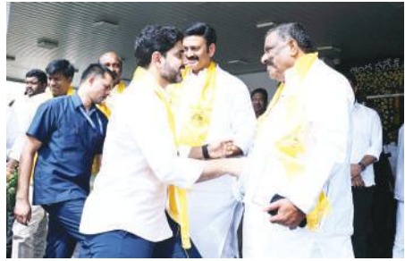
మంత్రి నారా లోకేష్ తో ఎమ్మెల్యే కోట్ల పరిష్కరించడంలో ప్రభుత్వం నుంచి పూర్తి సహకారం

అవసరమని కోట్ల సూర్యప్రకాశ్ రెడ్డి ముఖ్యమంత్రి నారా చంద్రబాబు నాయుడు, ఉపముఖ్యమంత్రి కోణిదెల పవన్ కళ్యాణ్, మంత్రి నారా లోకేష్ లకు విజ్ఞప్తి చేశారు. గత ప్రభుత్వ హయాంలో అభివృద్ధి పనుల్లో నిధుల దుర్వినియోగం, అవినీతి భారీ ఎత్తున ఉందని వాటిపై విచారణ నిర్వహించాలని కోట్ల సూర్య కోరారు. త్వరలో నియోజకవర్గంలో అభివృద్ధి కార్యక్రమాలపై అధికారులతో సమీక్ష నిర్వహించి అవసరమైన అభివృద్ధి పనుల కోసం నివేదికను సమర్పిస్తానని దానిపై సానుకూలంగా స్పందించి నిధులను విడుదల చేయాలని ఆయన చేసిన విజ్ఞప్తికి ముఖ్యమంత్రి, ఉప ముఖ్యమంత్రి, పలువురు మంత్రులు సానుకూలంగా స్పందించారు.