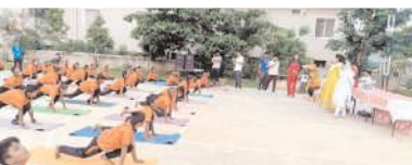
యోగాసనాలు చేస్తున్న విద్యార్థులు

కర్నూలు రూరల్, మేజర్ న్యూస్: కర్నూలు నగర శివారులోని బి.తాండ్రపాండు గ్రామంలో ఉన్న క్రేడ్ పాఠశాలలో శుక్రవారం అంతర్జాతీయ యోగా దినోత్సవాన్ని పురస్కరించుకొని ప్రముఖ యోగా ట్రైన్