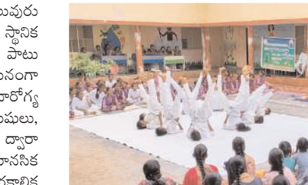
కస్తూర్బా పాఠశాలలో యోగా ఆసనాలు వేసిన విద్యార్థులు