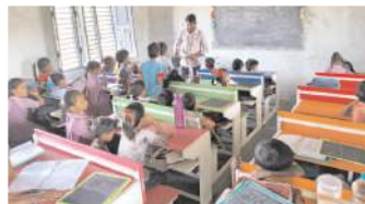
కొత్తపేట పాఠశాలలో బోధన చేస్తున్న ఉపాధ్యాయుడు

పెరుగుదలలో ఉందని బదులు తరగతులకు విద్యా బోధన చెయడం కష్టంగా మారినందున ఒకే ఉపాధ్యాయులు తమ ఆవేదనాన్ని వ్యక్తం చేస్తున్నారు. కొత్తగా