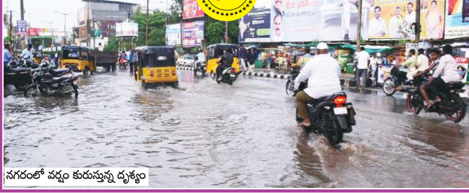
నగరంలో వర్షం కురుస్తున్న దృశ్యం