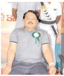
యోగాసనాలు వేస్తున్న కలెక్టర్

నంద్యాల కలెక్టర్, మేజర్ న్యూస్ : అతి ప్రాచీనమైన యోగాకు పూర్వ జైభవం తేవడంలో బీజేపీ ప్రభుత్వం సఫలమైందని, ప్రతి సంవత్సరం జూన్ 21వ తేదీని ప్రధానమంత్రి మోదీ యోగా దినోత్సవాన్ని నిర్వహించాలని 2015లో ప్రవేశపెట్టారు. దాదాపు పదేళ్లు క్రితం మోదీ అంతర్జాతీయ యోగా దినోత్సవాన్ని జరుపుకోవాలని పిలుపునివ్వడంతో ప్రతి యేడాది 21వ తేదీ యోగా దినోత్సవాన్ని జరుపుకోవడం ఆనవాయితీగా వస్తోంది. పతంజలి మహర్షి మానవుడికి అవసరమైన 12సూర్య సమస్కారాలతో పాటు మరెన్నో ఆసనాలు కుదించి మానవుడి ఆరోగ్యానికి అందించారు. మనోఅత్యుల పరిపూర్ణ వికాసమే యోగం అని చెప్పవచ్చు. యోగం పొందాలంటే యోగాసనాలు, ప్రాణాయామం, యమనియమాలు తప్పక పాటించాలి. యోగసాధన ఆరోగ్య సంరక్షణకు అనివార్యం. మానవుని దైనందిన ఆరోగ్య జీవన విధానంలో యోగసాధన ప్రధాన అంశంగా చెప్పవచ్చు. శుక్రవారం అంతర్జాతీయ యోగా దినోత్సవాన్ని యోగా కేంద్రాలు, ప్రభుత్వ కార్యాలయాల్లో యోగాసనాలు వేసే కార్యక్రమాన్ని నిర్వహించారు.