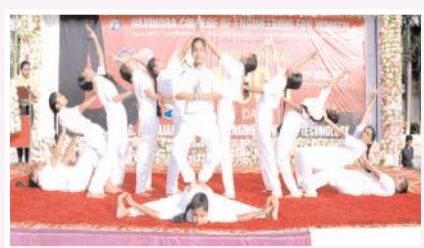
యోగాసనాలు వేస్తున్న విద్యార్థులు