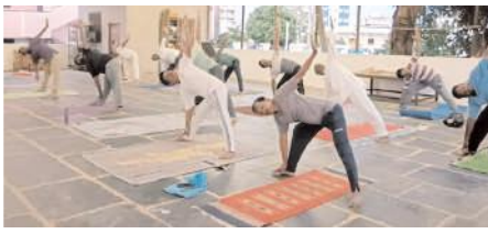
అమరయోగ వికాస కేంద్రంలో యోగాసనాలు ప్రదర్శిస్తున్న దృశ్యం

క్రీడాభారతి అధ్యక్షులలో : అంతర్జాతీయ యోగా