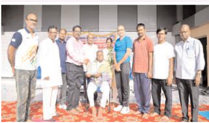
సన్మానం నిర్వహిస్తున్న దృశ్యం

యోగాతో ఆరోగ్య సమస్యలు దూరం - ఆర్యూ వీసీ సుధీర్ ప్రేమ్ కుమార్