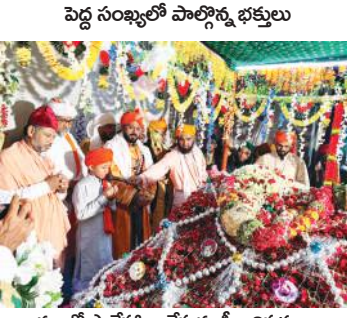
పెద్ద సంఖ్యలో పాల్గొన్న భక్తులు ఎమ్మిగనూరు టౌన్, మేజర్ న్యూస్ : మండల పరిధిలోని సిరాలడాడ్డి సబ్ స్టేషన్ వద్ద వెలిసిన శ్రీ సయ్యద్ బాబా ఫలీద్ స్వామి