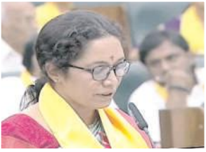
ప్రమాణస్వీకారం చేస్తున్న గౌరుచరితారెడ్డి

కల్లూరు, మేజర్ న్యూస్: ఇటీవల జరిగిన సార్వత్రిక ఎన్నికల్లో తెలుగుదేశం పార్టీ తరపున పాణ్యం నియోజకవర్గ ఎమ్మెల్యేగా గెలుపొందిన గౌరుచరితారెడ్డి శుక్రవారం ఎమ్మెల్యేగా ప్రమాణస్వీకారం చేశారు. విజయవాడలోని శాసనసభలో గౌరుచరితారెడ్డి మూడోసారి ఎమ్మెల్యేగా ప్రమాణస్వీకారం చేశారు. అనంతరం ముఖ్యమంత్రి చంద్రబాబునాయుడు, మంత్రి నారాలోకేశ్వరులు కలిశారు.