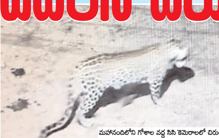
మహానందిలోని గోశాల వద్ద సిసి కెమెరాలలో చిరుతపులి