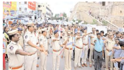
ప్రతిజ్ఞ చేయిస్తున్న దృశ్యం