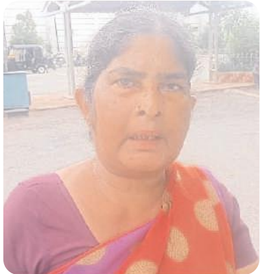
ఆవేదన వ్యక్తం చేస్తున్న బాధిత మహిళ

డోన్ రూరల్ మేజర్ న్యూస్ : పట్టణ సమీపంలోని దోరపల్లి కొండ ప్రాంతంలోని సర్వే నంబర్ 460లో గల తమ 4 ఎకరాల భూమిని కబ్బా కాకుండా కాపాడి న్యాయం చేయాలని పట్టణంలో ని త్రివర్ణ కాలనీకి చెందిన తెలుగు మహిళా అధికారులకు విజ్ఞప్తి చేశారు. ఆ మేరకు బుధవారం ఆమె పాత్రికేయులతో మాట్లాడుతూ తమ సోదరుని నుంచి పసుపు కుంకుమ కింద తమకు కబ్బా సంక్రమించిన నాలుగు ఎకరాల భూమిని కొంతమంది అక్రమంగా ఆన్లైన్లో నమోదు చేసుకొని అమ్మటానికి ప్రయత్నిస్తున్నారని, సదరు విషయం పై తాము ఇప్పటికే హైకోర్టును ఆశ్రయించగా ఫారం 6 ఏ ద్వారా తమ పేరు మీద చేయాలని రెవిన్యూ అధికారులను ఆదేశించినప్పటికీ తీవ్ర జాప్యం జరుగుతూ వస్తుందని ఆవేదన వ్యక్తం చేశారు. పట్టణానికి చెందిన కొంతమంది రాజకీయ నాయకుల అండదండలతో తమ భూమిని కబ్బా చేయాలని