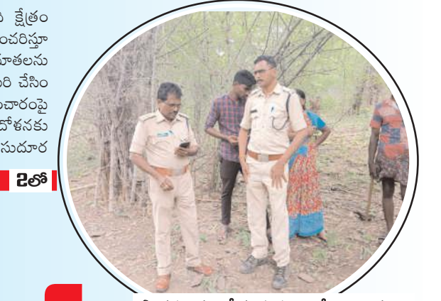
పాదముద్రలు సేకరిస్తున్న అటవీ అధికారులు