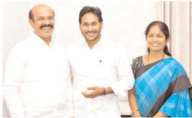
వైఎస్ జగన్తో ఎస్సీ దంపతులు