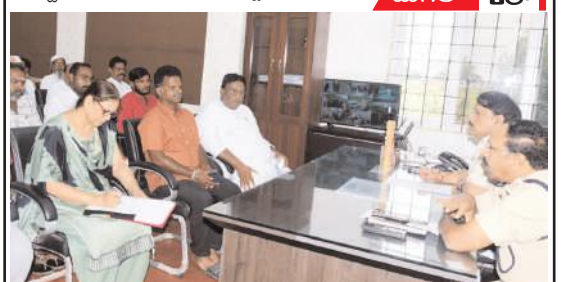
శాంతియుత కమిటీ సమావేశంలో మాట్లాడుతున్న జిల్లా కలెక్టర్ ఎస్పీ