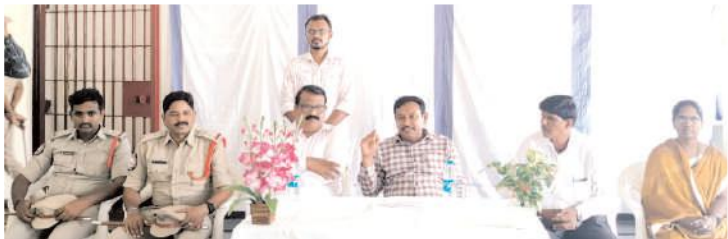
మాట్లాడుతున్న జిల్లా న్యాయ సేవాధికారి సంస్థ కార్యదర్శి

కర్నూలు లీగల్, మేజర్ న్యూస్: కర్నూలు నగర శివారులోని పంచలింగాల వద్ద ఉన్న జిల్లా, మహిళా కారాగారాలను శుక్రవారం