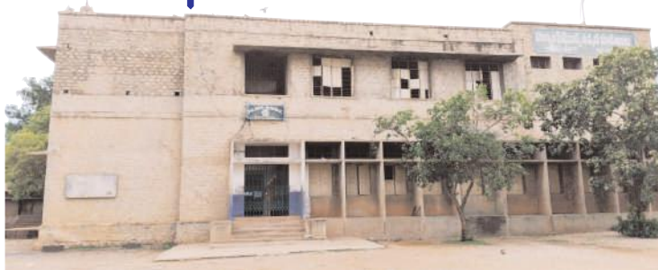
సిమెంట్ నగర్ ఎయిడెడ్ పాఠశాల దృశ్యం

కర్నూలు, సూర్యప్రతినిధి: బేతంచెర్ల మండలం సిమెంట్ నగర్ గ్రామంలో ని ఎయిడెడ్ ఉన్నత పాఠశాలలో చదువుతున్న విద్యార్థులు విద్యాభ్యాసం