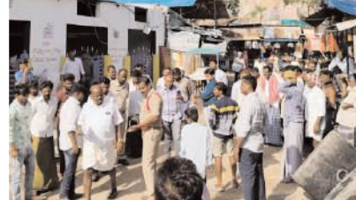
విచారణ చేసిన వక్ఫ్ బోర్డు అధికారులు, పోలీసుల దృశ్యం