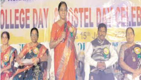
వ్యవసాయ కళాశాలలో మాట్లాడుతున్న ఏడీఆర్,