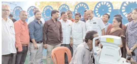
వైద్య పరీక్షలు నిర్వహిస్తున్న దృశ్యం

సేవా కార్యక్రమాలను ముందుకు తీసుకెళ్లాలి - కర్నూలు ఎంపీ బస్తిపాటి నాగరాజు