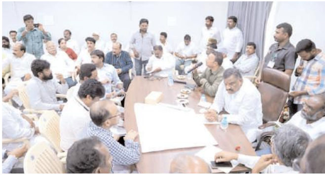
అధికారులతో సమీక్షసమావేశం నిర్వహించిన ఎమ్మెల్యే కోట్ల

డోన్, మేజర్ న్యూస్: డోన్ మండల అధికారులతో ఎమ్మెల్యే కోట్ల జయసూర్యప్రకాశ్ రెడ్డి డోన్ అభివృద్ధి సమీక్ష సమావేశం నిర్వహించారు. ఈ సందర్భంగా పట్టణంలోని ఆర్.ఎం.బి. గెస్ట్ హౌస్ నందు ఏర్పాటు చేసిన సమావేశంలో ఎమ్మెల్యే కోట్ల మాట్లాడుతూ ఆయా శాఖ అధికారులు ఎమ్మెల్యే కోట్ల జయసూర్యప్రకాశ్ రెడ్డి మర్యాదపూర్వకంగా పుష్పగుచ్ఛాలు, శాలువాలతో సత్కరించారు. అనంతరం ఆయన మాట్లాడుతూ డోన్ నియోజకవర్గంలో అభివృద్ధి కార్యక్రమాలపై పలు శాఖల అధికారులతో వివరాలను సేకరించారు. నూతనంగా ఏర్పడిన ప్రభుత్వంలో అధికారులు ప్రజలతో మమేకమై అభివృద్ధిని చేయాలన్నారు. నియోజకవర్గ ప్రజలు ఎన్.డి.యే ప్రభుత్వానికి అండగా నిలిచి ఎమ్మెల్యేగా తనను ఎన్నుకోవడం సంతోషంగా ఉందన్నారు. ఎన్నికల్లో ఇబ్బని హామీల్లో భాగంగా ప్రతి ఒక్క కుటుంబాన్ని ఆదుకుంటామని పేర్కొన్నారు. అధికారులు తమ విధులను సమర్థవంతంగా నిర్వహించి ప్రజల్లో