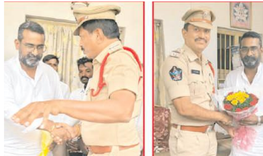
ఎమ్మెల్యే కే.ఈ.శ్యాంబాబును కలిసిన సిఐ, ఎస్సె

ఎమ్మెల్యే కే.ఈ.శ్యాంబాబును కలిసిన సిఐ, ఎస్సెలు వెల్లర్తి, మేజర్ న్యూస్: మండలంలోని ప్రజల శాంతిభద్రతలకు విఘాతం కలిగించే వారి తాటతీయాలని, అసాంఘిక కార్యకలాపాలకు పాల్పడే వారు ఎవ్వరైనా, మా పార్టీ నాయకులైనా సరే ఉపేక్షించవద్దని, ప్రజల శాంతిభద్రతలే మాకు ముఖ్యమని పత్రికాంధ నియోజకవర్గం ఎమ్మెల్యే కే.ఈ.శ్యాంబాబు వెల్లర్తి సర్కిల్ ఇన్స్పెక్టర్ బీ.వి.మధుసూదనరావు, ఎస్సె యు.సునీల్ కుమార్ లకు ఆదేశించారు. పత్రికాంధ నియోజకవర్గం ఎమ్మెల్యేగా ఎన్నికైన కే.ఈ.శ్యాంబాబును శుక్రవారం వెల్లర్తి సర్కిల్ ఇన్స్పెక్టర్ బీ.వి.మధుసూదనరావు, ఎస్సె యు.సునీల్ కుమార్ లు మర్యాదపూర్వకంగా కలిసి, పుష్పగుచ్ఛం అందించారు.