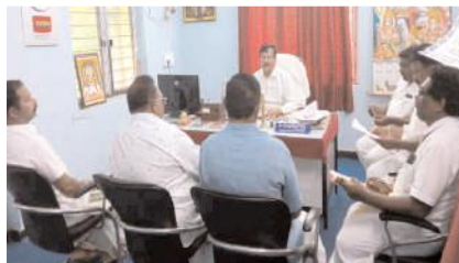
మహానంది కార్యాలయంలో వేలాలను నిర్వహిస్తున్న దృశ్యం