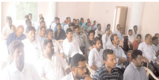
సమావేశానికి హాజరైన అధికారులు

గ్రామాల్లో మురుగు కాలువలు లేకపోవడంతో గ్రామాలు అధ్వాన్నంగా ఉన్నాయన్నారు. గిరిజన గూడల్లో ఉన్న గిరిజనులకు అధికారం లేకపోవడంతో సంక్షేమ పథకాలు అందడం లేదని తెలిపారు. ఈ సందర్భంగా ఎమ్మెల్యే గిత్తా జయసూర్య మాట్లాడుతూ కొత్తపల్లి