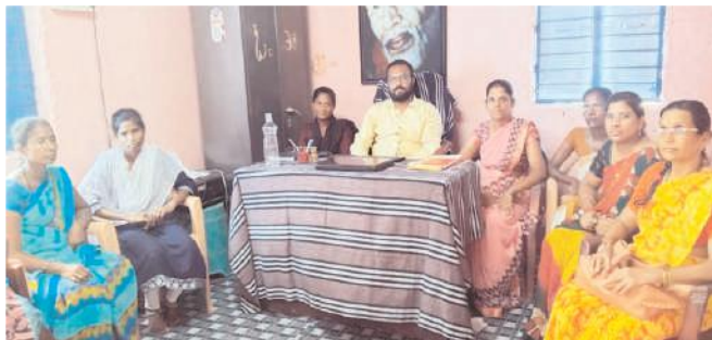
సమావేశంలో మాట్లాడుతున్న నారాయణ పాఠశాల కరస్పాండెంట్

- ఒకే కుటుంబంలో ముగ్గురు ఉంటే ఒకరికి ఉచిత విద్య