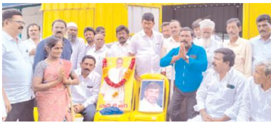
ఫింప్లెస్ పుస్తకం వ్యక్తం చేస్తున్న వికలాంగులు, టీడీపీ నాయకులు