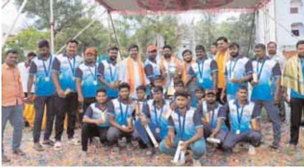
కందుకూరు, మేజర్ న్యూస్ (జూన్ 09): యువత క్రీడల్లో ప్రతిభ కనభర్చి

మృతుడి కుటుంబానికి బిఆర్ఎస్ నేత ఆర్థిక సహాయం