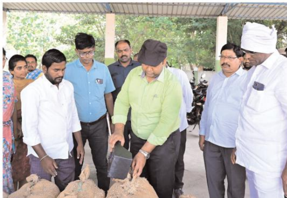
కొనుగోలు పూర్తిచేసి మిల్లులకు తరలించాలని జిల్లా అధికారులను ఆదేశించారు. ఈ కార్యక్రమంలో జిల్లా అధికారులు, సిబ్బంది తదితరులు పాల్గొన్నారు.

ఈ కొనుగోలు కేంద్రం నందు మిగిలి ఉన్న ధాన్యాన్ని ఈరోజు తో కొనుగోలు పూర్తి చేసి మరియు మిల్లులకు తరలించు కూడా పూర్తి చేయాలని నిర్దేశాలులను ఆదేశించారు. గత యాసంగి సీజన్లో జిల్లాలో ఈరోజు నాటికి 2,18,000.160 మెట్రిక్ టన్నుల ధాన్యం కొనుగోలు చేయటం జరిగింది. 410 కొనుగోలు కేంద్రాలలో యాభై ఎనిమిది (58) కొనుగోలు కేంద్రాలలో మాత్రమే ధాన్యం కొనుగోలు పూర్తి చేసారు. ప్రస్తుతం జిల్లాలో మొత్తం 410 కొనుగోలు కేంద్రాలు ఏర్పాటు చేసి ఇప్పటివరకు 2,70,120.440 మెట్రిక్ టన్నుల పరిధాన్యం 65,990 రైతుల వద్ద నుండి కొనుగోలు చేసి రూ. 490.54 కోట్లు చెల్లించడం జరిగింది. 344 కొనుగోలు కేంద్రాలలో ధాన్యం కొనుగోలు పూర్తి అయ్యిందని తెలిపారు. జిల్లాలో ధాన్యం కొనుగోలు ప్రక్రియ సజావుగా సాగుతుందని సంతృప్తి వ్యక్తం చేశారు. జిల్లాలో మిగిలి ఉన్న ధాన్యాన్ని కూడా త్వరితగతిన