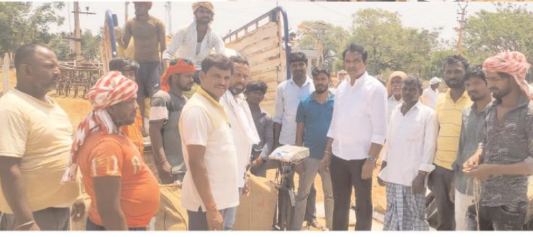
ఈ కార్యక్రమంలో వారి వెంట కార్యదర్శి మరియు రైతు సోదరులు తదితరులు పాల్గొన్నారు.