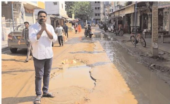
అధ్వర్యంలో పెద్ద ఎత్తున అందోళనలు నిర్వహిస్తామని ఆయన హెచ్చరించారు.