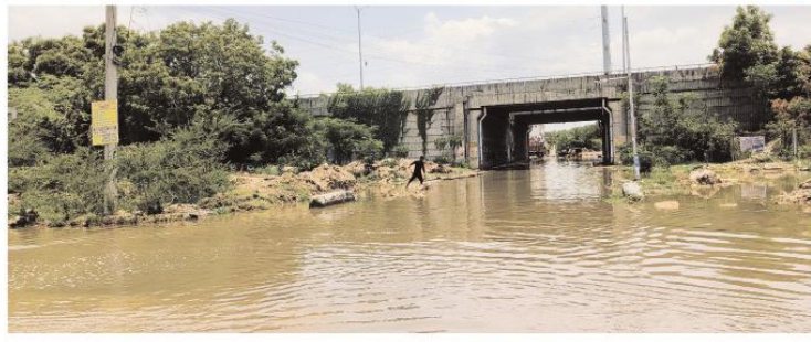
జిన్నారం మేజర్ స్కూల్స్:బొల్లారం మున్సిపాలిటీ పరిధిలోని ఔటర్ రింగ్ రోడ్డు సమీపంలో గల సర్వీస్ రోడ్డు భారీగా చేరిన వరద నీటితో చెరువును తలపిస్తోంది.కాజిపల్లి నారాయణ కళాశాల ముందుగా రోడ్డు మార్గం ఇటీవల కురిసిన భారీ వర్షానికి వరద నీరు చేరడంతో రాకపోకలకు అటంకం ఏర్పడింది.దీంతో ప్రయాణికులు వాహనదారులు, పాదాచారులు తీవ్ర ఇబ్బందులు పడుతూ అసహనానికి గురవుతున్నారు.వరద నీటిని అధికారులు సకాలంలో తొలగించి సమన్వయ పరిష్కారించాలని స్థానికులు కోరుతున్నారు.