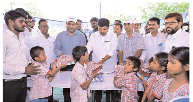
ఉత్తమ ప్రతిభ కనబరిచిన విద్యార్థులకు నగదు అందజేత