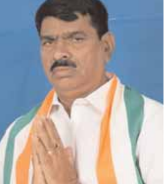
ఉద్యోగులతో సమానంగా చెల్లించాలి. ప్రభుత్వ ఉద్యోగులతో పాటు ఆర్టీసి కార్మికులకు కూడ మాస్టరు స్టైల్ అమలు పర్చాలని కె.రాజరెడ్డి ఎస్ డబ్ల్యూ యు రాష్ట్ర కమిటీ నాయకులు కోరారు.

కర్నూల్ ఘాట్ ,మేజర్ న్యూస్ ; ఆర్టీసీ కార్మికులకు 1 ఏప్రిల్ 17 నుండి రావలసిన వేతన సవరణ జూన్ 1 వ తేదీ నుండి అమలు చేస్తూ పెంచిన కొత్త జీతాలు చెల్లించినందున తెలంగాణ ముఖ్యమంత్రి ఎనుముల రేవంత్ రెడ్డి, రవాణా శాఖ మంత్రి పొన్నం ప్రజాకర్ గౌడ్, ఆర్టీసి యాజమాన్యానికి ధన్యవాదాలు తెలుపుతున్నట్లు టీజీఎస్ ఆర్టీసీ ఎస్ డబ్ల్యూ యు ఐ ఎన్ టి యు సి రాష్ట్ర కమిటీ ఆధివారం పత్రికా ప్రకటన విడుదల చేసింది కాంగ్రెస్ పార్టీ ఎన్నికల ప్రణాళికలో ఇచ్చిన హామీల్లో ఒకటైన 2017 వేతన సవరణను అమలు చేయడాన్ని మరియు సి సి ఎస్ సమస్య పరిష్కరించే లోన్ పెట్టుకుంటే గతంలో సంవత్సరాల్లో లోన్ రాకుండా చాలా మంది కార్మికులు ఆర్థికంగా ఎన్నో ఇబ్బందులు పడ్డారు. అలాంటిది లోన్ పెట్టిన వారికి వారం లోన్ లోన్ చెల్లించే విధంగా వూర్వపు పరిస్థితుల తీసుకువచ్చిన ఈ ప్రభుత్వానికి ఎస్ డబ్ల్యూ యు రాష్ట్ర కమిటీ ధన్యవాదాలు తెలుపు తున్నట్లు ప్రకటించారు. 2013 వేతన సవరణ బాండ్లను , డ్రైవర్లకు మాత్రమే విడుదల చేశారని , మిగిలిన క్యాబ్ గిరిలకు కూడా బాండ్ల డబ్బులు విడుదల చేసి 3వ సమస్యను కూడ సంపూర్ణంగా వెంటనే పరిష్కరించాలని కె.రాజరెడ్డి ఎస్ డబ్ల్యూ యు నాయకులు రాష్ట్ర ప్రభుత్వానికి విజ్ఞప్తి చేశారు . కాంగ్రెస్ పార్టీ ఎన్నికల ప్రణాళికలో