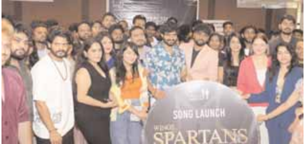
హైదరాబాద్, మేజర్ న్యూస్: రియాల్టీ గేమ్స్ షోలకు క్రేజ్ పెరుగుతోంది. సామాన్యులకు మొట్టమొదటి తెలుగు రియాల్టీ గేమ్ షో వింగ్స్ స్పార్టాన్స్...ఐ కెన్...ఐ విత్ పేరుతో హైదరాబాద్ కు చెందిన వింగ్స్ మోడల్ హాట్