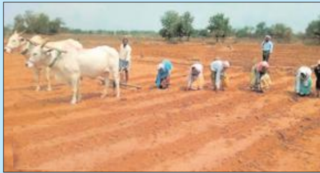
నల్గొండ జిల్లా బ్యూరో

జిల్లాలో పలుచోట్ల కురిసిన వర్షాలు పంట సాగులో నిమగ్నమైన రైతులు అంచనాలు సిద్ధం చేసిన వ్యవసాయశాఖ