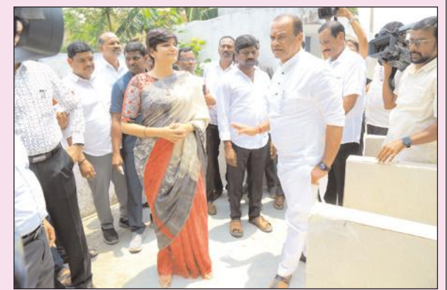
ప్రతినిధులు, ఉపాధ్యాయులు, తదితరులు హాజరయ్యారు. ఈ సందర్భంగా మంత్రి పాఠశాల ఆవరణలో మొక్కలు నాటారు అంతేకాక టాయిలెట్లను తనిఖీ చేశారు.