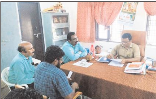
చింతలపాలెం, మేజర్ న్యూస్ : మండల కేంద్రంలో గల సీతా మెమోరియల్ స్కూల్పై గత కొన్ని రోజులుగా వస్తున్న పత్రిక కథనాలపై

ఫీజులు గురించి తల్లిదండ్రులను ఇబ్బంది పెట్టొద్దు