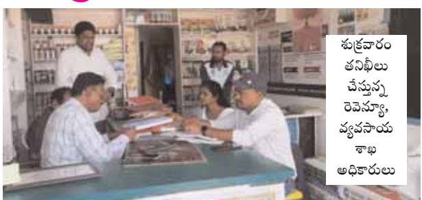
శుక్రవారం తనిఖీలు చేస్తున్న రెవెన్యూ, వ్యవసాయ శాఖ అధికారులు

కొందుర్లు, మేజర్ న్యూస్ ( జూన్ 3): వ్యవసాయ సీజన్ వచ్చినప్పుడే అధికారులు హడావుడి చేసి ఫర్టిలైజర్ దుకాణాలను తనిఖీ చేస్తున్నారే తప్ప మిగతా సమయాలలో కన్పించకుండా పోతున్నారు. మండల వ్యవసాయ శాఖ పోలీస్, రెవెన్యూ శాఖల అధికారులు బృందాలుగా ఏర్పడి దుకాణాలలో తనిఖీ చేసి రికార్డులు పరిశీలించి చేతులు దులుపుకుంటున్నారే తప్ప పూర్తి స్థాయిలో ఎక్కడ చర్యలు తీసుకోకపోవడం లేదని మండల రైతులు ఆరోపిస్తున్నారు. డీలర్ల కనుసైగలోనే ఎరువులు, విత్తనాల దుకాణాలను మొక్కుబడిగా తనిఖీలు చేస్తున్నారే తప్ప పూర్తి స్థాయిలో పరిశీలించడం లేదని ఆరోపనలు బహిరంగంగానే వినిపిస్తున్నాయి. ఒక వైపు కరీఫ్ సీజన్ ముంచుకొస్తుంటే అధికారులు హడావుడి గా తనిఖీ చేస్తున్నారే తప్ప నకిలీ విత్తనాలు, ఎరువులను నియంత్రించడంలో మాత్రం పూర్తిగా విఫలమవుతున్నారని అన్నదాతలు ఆవేదన వ్యక్తం చేస్తున్నారు. అధిక ధరలకు ఎరువులు, విత్తనాలు డీలర్లు విక్రయిస్తుంటే అధికారులు చూసి చూడనట్లు వ్యవహరిస్తున్నారని అన్నదాతలు వాపోతున్నారు. తనిఖీల సమయంలోనే అధికారులు కన్పిస్తున్నారనే తప్ప మిగతా సమయాలలో మాత్రం అటు వైపు కన్నెత్తి చూడడం లేదని ఆవేదన వ్యక్తం చేస్తున్నారు. ఇలాంటి సంఘటనల నేపథ్యంలో అధిక ధరలకు డీలర్లు క్రయ విక్రయాల చేస్తుంటే అధికారులు మాత్రం బిల్లులు కావాలని చెప్పడం విడ్డూరంగా ఉందని అన్నదాతలు అంటున్నారు. ఎరువులు విత్తనాల విషయంలో అన్నదాతలకు అవగాహన కల్పించాల్సిన అధికారులు తనిఖీల పేరుతో కాలయాపన చేస్తున్నారే తప్ప దాంతో ఎలాంటి లాభం చేకూరడం లేదని స్పష్టంగా తెలుస్తుందని అంటున్నారు. డీలర్లు ప్రభుత్వం గుర్తించిన కంపెనీల విత్తనాలను చూపించి దోడ్డి దొరిన నకిలీ విత్తనాలను విక్రయిస్తుంటే అధికారులు మాత్రం తమకేమి తెలియదంటూ చేతులు