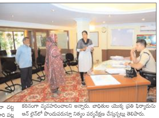
కఠినంగా వ్యవహరించాలని అన్నారు. బాధితుల యొక్క ప్రతి ఫిర్యాదును ఆన్ లైన్ లో పొందుపరుస్తూ నిత్యం పర్యవేక్షణ చేస్తున్నట్లు తెలిపారు.

నల్గొండ జిల్లా బ్యూరో ప్రతి సోమవారం ప్రజల సౌకర్యార్థం నిర్వహించే గ్రీవెన్స్ డే భాగంగా ఈ రోజు జిల్లా పోలీస్ కార్యాలయంలో జిల్లాలోని వివిధ ప్రాంతాల నుండి వచ్చిన దాదాపు 80 మంది అర్జీదారులతో నేరుగా మాట్లాడి తమ సమస్యలను తెలుసుకొని సంబంధిత అధికారులతో ఫోన్ లో మాట్లాడి పూర్తి వివరాలు సమర్పించాలని ఆదేశించారు. ఈ రోజు వచ్చిన ఫిర్యాదులు భూ సమస్యలు, భార్య భర్త మధ్య విభేదాలు, ఫైనాన్స్ మసల్లలపై వచ్చిన వచ్చాయని తెలిపారు. ఈ సందర్భంగా మాట్లాడుతూ ప్రజలకు పోలీస్ శాఖను మరింత చేరువ చేయాలన్నారు. పోలీస్ స్టేషన్ కి వచ్చిన ఫిర్యాదుదారులతో మర్యాదగా మాట్లాడి వివరాలు స్వీకరించి సంబంధిత ఫిర్యాదులపై క్షేత్ర స్థాయిలో పరిశీలించి వేగంగా స్పందించి బాధితులకు న్యాయం జరిగే విధంగా చూడాలన్నారు. ఫిర్యాదు దారునికి భరోసా, సమ్మతం కలిగించాలన్నారు. ఎవరైనా చట్ట వ్యతిరేకమైన చర్యలు చేస్తూ శాంతి భద్రతలకు భంగం కలిగించే వారి పట్ల