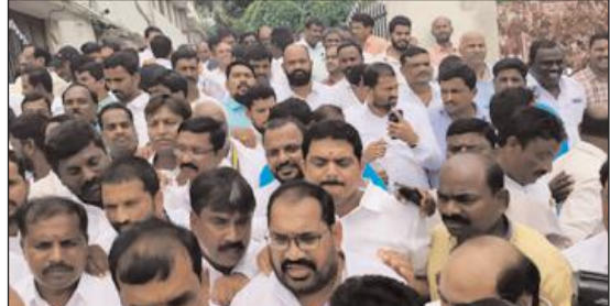
ప్రజా ప్రతినిధులు, కాంగ్రెస్ పార్టీ నాయకులు, యువజన కాంగ్రెస్, ఎన్ఎన్ఎంబి కార్యకర్తలు పాల్గొన్నారు.