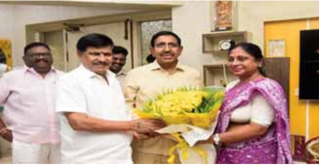
- అందరికీ అండగా ఉంటా

- శ్రీనివాసులురెడ్డి, తాళ్లపాక దంపతులను కలిసిన