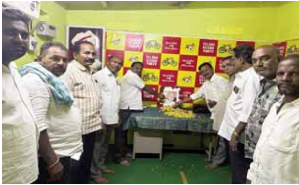
బోగోలు మేజర్ న్యూస్ :-అక్షర శిల్పి, ఈనాడు గ్రూప్ సంస్థల చైర్మన్