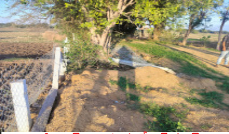
ఎల్లారెడ్డి జూన్ 24, సూర్య మేజర్ న్యూస్