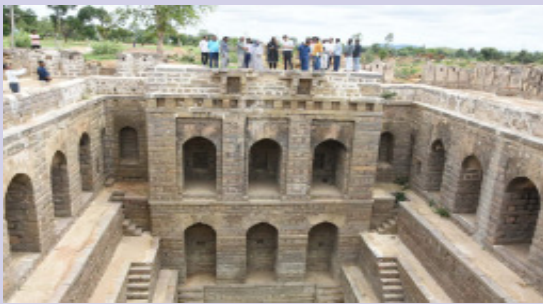
లింగంపేట్, జూన్ 27, సూర్య మేజర్ న్యూస్

ప్రాచీన కట్టడాలను పరిరక్షించేందుకు స్వచ్ఛంద సంస్థలకు ముందుకు రావడం అభినందనీయమని జిల్లా కలెక్టర్ ఆశిష్ సాంగ్వాన్ అన్నారు. ఆయన గురువారం లింగంపేట్ మండల కేంద్రంలోని నాగన్న మెట్ల భవని సందర్శించి పరిశీలించారు. ఉపాధి హామీ పథకంతో నాగన్న మెట్ల భావనీ పర్మిషన్ రోడ్డు వేస్తూ రోడ్డుకు ఇరువైపులా అవెన్యూ ప్లాంటేషన్ తో మొక్కలు నాటించాలన్నారు. బావి చుట్టూ రక్షణ ఏర్పాటు చేస్తూ నాలుగు ఐమాక్స్ లైట్లు ఏర్పాటు చేయాలని అధికారులకు ఆదేశించారు. ప్రాచీన కట్టడాలను భావితరాలకు తెలియజేయడానికి స్వచ్ఛంద సంస్థలు పునరుద్ధరించడం పట్ల హార్షం వ్యక్తం చేశారు. అనంతరం అమ్మ ఆదర్శ పాఠశాలలో జరుగుతున్న మర మృతులు పనులు పరిశీలించారు. విద్యార్థులకు మంచి రుచికరమైన వంటలను అందాలని ఏజెన్సీ నిర్వాహకులకు సూచించారు. పాఠశాలలో విద్యార్థులు సామర్థ్యాలను అడిగి తెలుసుకుని విద్యార్థులకు గణితం బోధించారు. కలెక్టర్ అడిగిన ప్రశ్నలకు విద్యార్థులు సరైన సమాధానం చెప్పడంతో సంతృప్తి వ్యక్తం చేశారు. నోటు పుస్తకాలు పంపిణీ చేసి మంచిగా చదువు కోవాలని విద్యార్థులకు సూచించారు. మండల కేంద్రంలోని