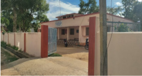
కామారెడ్డి బ్యారో, జూన్ 27, సూర్య మేజర్ న్యూస్

పంచాయతీ ఎన్నికలు పక్కదారి పట్టిన వ్యవహారంపై ఆడిట్ అధికారులు దృష్టి సారిస్తున్నారు. నిబంధనలకు విరుద్ధంగా ఖర్చు చేసిన నిధులను తిరిగి రాబట్టడానికి చర్యలు ప్రారంభించారు. ఆయా పంచాయతీలకు రిపోర్ట్ లేఖలను పంపించారు. 2022-23 వార్షిక ఏడాదికి సంబంధించిన పంచాయతీల లెక్కలపై ఆడిట్ శాఖ లోపాలను ఎత్తి చూపించింది. ఆయా పాలకవర్గాల నిర్లక్ష్య వైఖరికి బహిరంగతం చేసింది నిధుల దుర్వినియోగం లెక్కల్లో తేడాలు నిబంధనలకు వ్యతిరేకంగా చేసే ఖర్చులు వివరాలను వెల్లడించింది. వీటిని ప్రభుత్వానికి నివేదించనుంది జిల్లాలో 526 పంచాయతీల ఆడిట్ నివేదికలు పూర్తికాగా 6418 అభ్యంతరాలు వ్యక్తం అయ్యాయి. మొత్తంగా 7.59 కోట్ల లెక్కలకు తేడాలు ఉన్నట్లు అధికారులు పేర్కొంటున్నారు.