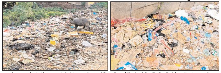
అవాసాలాగా మారి రోగాల బారిన పట్టణవాసులు పడే పై ప్రత్యేక దృష్టి పెట్టి చెత్తను తొలగించాలని ఆ అవకాశం ఉంది. పంచాయతీ అధికారులు పారిశుధ్యం ప్రాంతవాసులు కోరుచున్నారు.

నిజాంపట్నం, మేజర్న్యూస్: మండల కేంద్రమైన నిజాంపట్నంలోని పలు ప్రాంతాలలో పారిశుధ్య లోపంతో పరిశ ప్రాంతాలు దుగ్ధంధంగా మారాయి. నిజాంపట్నం పాత సినిమా హాలు వెనుక రైస్ మిల్ మరియు వైన్ షాప్ ఎదురుగా ఉన్న ఖాళీ ప్రదేశంలో ప్లాస్టిక్ వ్యర్థాలు, పాడి చెత్త, ఇతర వ్యర్థాలతో పెద్ద డంపింగ్ యార్డ్ లా తలపిస్తుంది. పేరుకుపోయిన చెత్తతో ఆ ప్రాంతమంతా దుర్వాసన వస్తుందని స్థానికులు వాపోతున్నారు. చెత్త వ్యర్థాలు కుళ్ళిపోయి ఆ దారిన వెళ్ల గ్రామ ప్రజలకు దుర్వాసన వస్తుందని వారు వాపోతున్నారు. పంచాయతీ సిబ్బంది సకాలంలో చెత్తను తొలగించకపోవడంతో దోమలకు ఆ ప్రాంతాలు