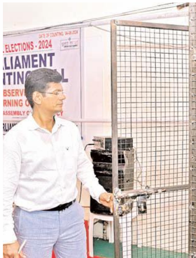
సూర్యప్రతినిధి - ఒంగోలు

కొన్ని గంటల్లో ఓట్ల లెక్కింపు ప్రక్రియ ప్రారంభం అభ్యర్థుల రాజకీయ భవితను తేల్చునున్న ఫలితాలు ఇప్పటికే ఎగ్జిట్ పోల్స్ సర్వేలో కూటమిదే పీఠం అభ్యర్థుల గుండెల్లో మొదలైన లబ్దబద్ ఒంగోలుకు చేరుకుంటున్న అభ్యర్థులు, పార్టీ క్యాడర్ నగరంలో హెమాటాక్సీ హాస్పిటల్ బోర్డులు గెలుపు భీమాలో అభ్యర్థులు, ఫలితాలపై ఉత్కంఠ