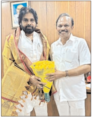
ఉప ముఖ్యమంత్రి పవన్ కల్యాణ్ కు మాగుంట శుభాకాంక్షలు

ఒంగోలు, మేజర్ న్యూస్: ఆంధ్రప్రదేశ్ రాష్ట్ర ఉప ముఖ్యమంత్రి కొణిదల పవన్ కల్యాణ్ ని ఒంగోలు పార్లమెంట్ సభ్యులు మాగుంట శ్రీనివాసులు రెడ్డి శనివారం సచివాలయంలో మర్యాదపూర్వకంగా కలిశారు. పుష్పగుచ్ఛం అందజేసి శుభాకాంక్షలు తెలియజేసి శాలువతో సత్కరించారు. అనంతరం పలు విషయాలు మాట్లాడుకున్నారు.