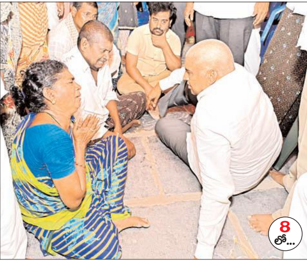
గోపికృష్ణ కుటుంబానికి అండగా ప్రభుత్వం: ఎమ్మెల్యే వేగేశన నరేంద్రవర్మ

స్థానికుల కాళ్ళు పట్టుకొని బతిమిలాడడంతో పోలీసులకు పట్టించకుండా వదిలేశారు. బాపట్ల ఇంజనీరింగ్ కళాశాల ప్రాంతం వద్ద, వేడుళ్లపల్లి గ్రామాలలో గంజాయి కంపు కొడుతుంది. సాయంత్రం అరు దాటితే రైలు కట్టలను కేంద్రంగా గంజాయి విక్రయాలు చేస్తూ సొమ్ము చేసుకుంటున్నారు. ఇటీవల కాలంలో పక్కా సమాచారంతో ఓ గంజాయి స్థావరంపై అధికారులు తనిఖీ చేయడానికి వెళ్ళిన సమయంలో ముందస్తు సమాచారం అందడంతో విక్రయాలు దారులు జాగ్రత్త పడ్డారని ప్రచారం జరుగుతుంది. ఏది ఏమైనప్పటికీ బాపట్ల ఇంజనీరింగ్ కాలేజీ సమీపంలో గంజాయి విక్రయాలు జరగడం ద్వారా ఎందరో విద్యార్థుల భవిష్యత్తు గాలిలో కలిసిపోతుంది. తల్లిదండ్రుల ఆశయాలు నెరవేర్చే ఉద్యోగాలు చేయవలసిన విద్యార్థులు గంజాయి బారిన పడి చెడు వ్యసనాలకు తయారై తల్లిదండ్రులకు కన్నీరు మిగిలిస్తున్నారు. ఇప్పటికైనా జిల్లా ఎస్పీ గంజాయి విక్రయదారులపై కఠినంగా వ్యవహరించాలని విద్యార్థుల తల్లిదండ్రులతో పాటు ప్రజలు కోరుతున్నారు.