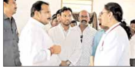
సిబ్బందితో సమావేశమయ్యారు. రోగులకు సరిపడా