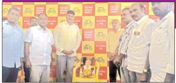
బాపట్ల టౌన్, మేజర్ న్యూస్: రామోజీ గ్రూప్ సంస్థల అధినేత రామోజీరావు మృతి బాధాకరం. బాపట్ల పట్టణం తెలుగుదేశం పార్టీ కార్యాలయంలో