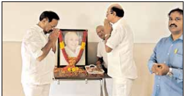
గ్రామాల్లో ఈనాడు సంస్థల అధినేత రామోజీరావు మృతి పట్ల పలువురు సామాజికవేత్తలు, టీడీపీ నాయకులు తమ సంతాపం వ్యక్తం చేశారు.