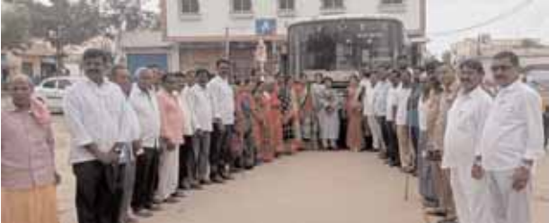
బస్సు సేవలను ప్రారంభిస్తున్న దృశ్యం.