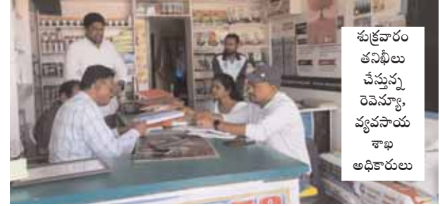
శుక్రవారం తనిఖీలు చేస్తున్న రెవెన్యూ, వ్యవసాయ శాఖ అధికారులు

కొందుర్లు, మేజర్ న్యూస్ (జూన్ 3): వ్యవసాయ సీజన్ వచ్చినప్పుడే అధికారులు హడావుడి చేసి ఫర్టిలైజర్ దుకాణాలను తనిఖీ చేస్తున్నారే తప్ప మిగతా సమయాలలో కన్పించకుండా పోతున్నారు. మండల వ్యవసాయ శాఖ పోలీస్, రెవెన్యూ శాఖల అధికారులు బృందాలుగా ఏర్పడి దుకాణాల్లో తనిఖీ చేసి రికార్డులు పరిశీలించి చేతులు దులుపుకుంటున్నారే తప్ప పూర్తి స్థాయిలో ఎక్కడ చర్యలు తీసుకోకపోవడం లేదని మండల రైతులు ఆరోపిస్తున్నారు. డీలర్ల కనుసైగలోనే ఎరువులు, విత్తనాల దుకాణాలను మొక్కుబడిగా తనిఖీలు చేస్తున్నారే తప్ప పూర్తి స్థాయిలో పరిశీలించడం లేదని ఆరోపనలు బహిరంగంగానే వినిపిస్తున్నాయి. ఒక వైపు కరీఫ్ సీజన్ ముంచుకొస్తుంటే అధికారులు హడావుడి గా తనిఖీ చేస్తున్నారే తప్ప నకిలీ విత్తనాలు, ఎరువులను నియంత్రించడంలో మాత్రం పూర్తిగా విఫలమవుతున్నారని అన్నదాతలు ఆవేదన వ్యక్తం చేస్తున్నారు. అధిక ధరలకు ఎరువులు, విత్తనాలు డీలర్లు విక్రయిస్తుంటే అధికారులు చూసి చూడనట్లు వ్యవహరిస్తున్నారని అన్నదాతలు వాపోతున్నారు. తనిఖీల సమయంలోనే అధికారులు కన్పిస్తున్నారనే తప్ప మిగతా సమయాలలో మాత్రం అటు వైపు కన్నెత్తి చూడడం లేదని ఆవేదన వ్యక్తం చేస్తున్నారు. ఇలాంటి సంఘటనల నేపథ్యంలో అధిక ధరలకు డీలర్లు క్రయ విక్రయాల చేస్తుంటే అధికారులు మాత్రం బిల్లులు కావాలని చెప్పడం విద్వేషంగా ఉందని అన్నదాతలు అంటున్నారు. ఎరువులు విత్తనాల విషయంలో అన్నదాతలకు అవగాహన కల్పించాల్సిన అధికారులు తనిఖీల పేరుతో కాలయాపన చేస్తున్నారే తప్ప దాంతో ఎలాంటి లాభం చేకూరడం లేదని స్పష్టంగా తెలుస్తుందని అంటున్నారు. డీలర్లు ప్రభుత్వం గుర్తించిన కంపెనీల విత్తనాలను చూపించి దోడ్డి దారిన నకిలీ విత్తనాలను విక్రయిస్తుంటే అధికారులు మాత్రం తమకేమి తెలియదంటూ చేతులు