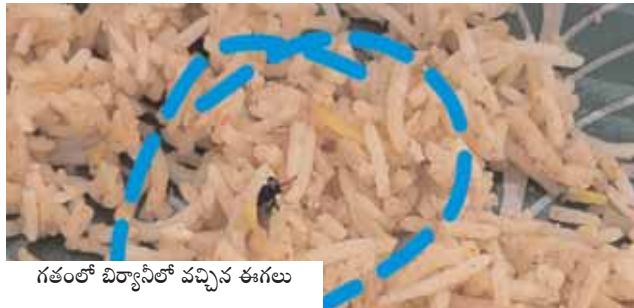
గతంలో బిర్యానీలో వచ్చిన ఈగలు

కందుకూరు, మేజర్ న్యూస్ ( జూన్ 03): గత కొంత కాలంగా ఎక్కడ పడితే అక్కడ బిర్యానీ సెంటర్లు, టిఫిన్ సెంటర్లు వెలుస్తున్నాయి. వాటిలో పరిశుభ్రత పాటించ కపోవడం నాణ్యత ప్రమాణాలు లేకపోవడంతో నిర్వహకులు అడిందే ఆట పాడిందే పాటగా కొనసాగుతున్నాయి. ప్రతిరోజు ఎక్కడో ఒకచోట బిర్యానీలో ఈగలు, దోమలు, పురుగుల కథనాలు వెలుగులోకి వస్తున్నాయి. కందుకూరు మండల కేంద్రంలో వెలసిన బిర్యానీ సెంటర్లు, రెస్టారెంట్ల పేరుతో వెలసిన హోటల్లలో పరిశుభ్రత, నాణ్యత ప్రమాణాలు పాటించక పోవడంతో కత్తి, నాణ్యత లేని ఆహారం అందిస్తున్నారు. ఈగలు, దోమలు, చీమలు, పురుగుల పడ్డ ఆహారం ఎన్నో సార్లు