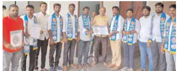
వినతి పత్రం అందజేస్తున్న నాయకులు