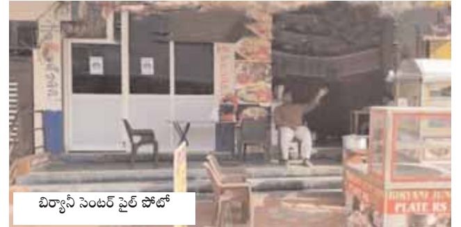
బిర్యానీ సెంటర్ ఫైల్ ఫోటో

భోజన ప్రియులకు వచ్చిన నిర్వహకులు అప్పటి సమయం వరకు క్షమాపణతో సరిపెట్టుకుని తర్వాత యథా ప్రజా తథా భోజనం అన్నట్లు కొనసాగిస్తున్నారు. నాణ్యతలేని వంట పస్తువులు వాడుతూ, మిగిలిన ఆహార పదార్థాలను ప్రిడ్డిల్లో పెట్టి మరుసటి రోజు కస్టమర్లకు అందిస్తున్నారు. ఇటీవల కల్లీ ఆహారంలో ప్రజలకు తీవ్ర అస్వస్థతకు గురై ఆసుపత్రుల పాలైన సంఘటనలు ఎన్నో జరిగాయి. ఇంత జరుగుతున్న ఫుడ్ సేఫ్టీ, సంబంధిత అధికారులు హోటల్లు, టిఫిన్ సెంటర్లలో పరిశుభ్రత, ప్రమాణాలు పాటించని వాటిపై కఠిన చర్యలు తీసుకోవాలని ప్రజలు డిమాండ్ చేస్తున్నారు.