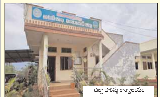
జిల్లా ఫారెస్టు కార్యాలయం