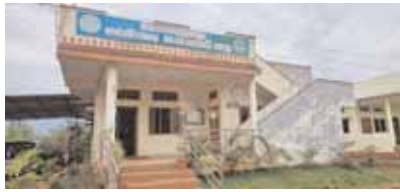
జిల్లా ఫారెస్టు కార్యాలయం

వికారాబాద్ మేజర్ న్యూస్ (జూన్ 03): ఎట్టకేలకు వికారాబాద్ ఫారెస్టు కార్యాలయంలో ఉన్న అవినీతి అధికారులు చిక్కులో పడ్డారు. ఆ కార్యాలయంలో ఎన్నో ఏళ్లుగా అవినీతికి పాల్పడుతున్న అధికారులకు తెర పడినట్లు తెలుస్తుంది. వివరాలలోకి వెళితే... 2017 నుండి ఫారెస్టు శాఖ కాంట్రాక్టు పద్ధతిన కూలీలతో తూనీకాకు తెంపిస్తుంది. అయితే వికారాబాద్ జిల్లాలో మొత్తం 8 క్లస్టర్ గా విభజించి కాంట్రాక్టర్లు తెంపిన తూనీకాకును సేకరించి ఫారెస్టు శాఖకు పంపిస్తుంది. 2017-18 సంవత్సరంలో తూనీకాకుకు ఫారెస్టు శాఖకు అధిక లాభాలు రావడంతో ఉన్నత అధికారులకు తూనీకాకు తెంపిన కూలీలకు బోనస్ ఇవ్వాలని నిర్ణయించింది. అందులో కూలీల వివరాలను తెలుపాలని ప్రధాన కార్యాలయం నుండి ఆదేశాలు వచ్చాయి. ఇదే అదునుగా చూసుకొని వికారాబా జిల్లా ఫారెస్టు కార్యాలయంలో కొందరు అధికారులు అవినీతికి పాల్పడినట్లు ఆరోపణలు వ్యక్తం అవుతున్నాయి. సరైన కూలీల వివరాలను ఇవ్వకుండా ఫారెస్టు కార్యాలయంలో పని చేసే సిబ్బంది బ్యాంక్ వివరాలు, తమ అనుచరుల వివరాలు ఇచ్చారు. దీంతో బోనస్ డబ్బులు గొట్టిముక్కులకు చెందిన