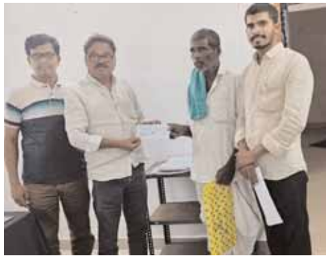
చెక్కును అందజేస్తున్న దృశ్యం.

యువ న్యాయవాది ఎలక్రిషన్ డిపార్ట్మెంట్ డి.ఈ తో మాట్లాడి 40000 రూపాయల చెక్కు ను వికారాబాద్ లోని విద్యుత్ కార్యాలయంలో రైతు కిష్టయ్యకు అందజేశారు.