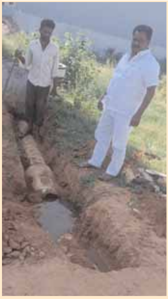
కాలనీలో మురికి కాలువ సమస్యల పరిష్కారం