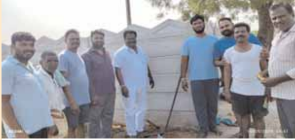
ఎస్సె కాలనీలో హైమాస్ట్ లైట్ ఏర్పాటు