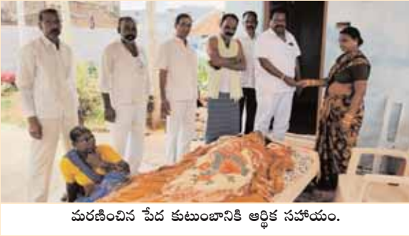
మరణించిన పేద కుటుంబానికి ఆర్థిక సహాయం.