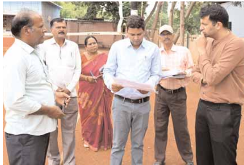
ఆదర్శ పాఠశాలలను పరిశీలిస్తున్న దృశ్యం. పనులకు ఇప్పటి వరకు వచ్చిన బడ్జెట్ లో చేసిన పనులను పరిశీలించారు. మగతా 3లో