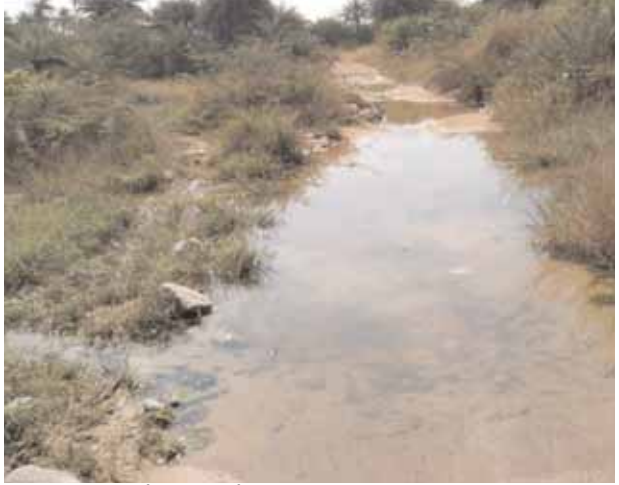
నిధులు విడుదల చేసిన వెంటనే వంతెనల నిర్మాణ పనులు ప్రారంభమవుతాయి