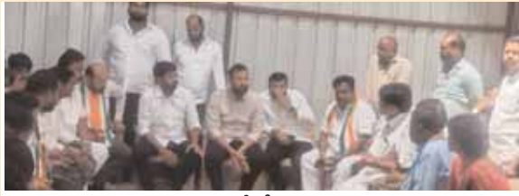
చురుకుగా కాంగ్రెస్ పార్టీలో నాయకత్వ వ్యవహారాలు

అనేక ఇండ్లలో వెలుగులు నింపిన నాయకుడు ఆపద్బొందింటే మనకెందుకులే అనుకుంటున్న ఈ రోజుల్లో ఆ